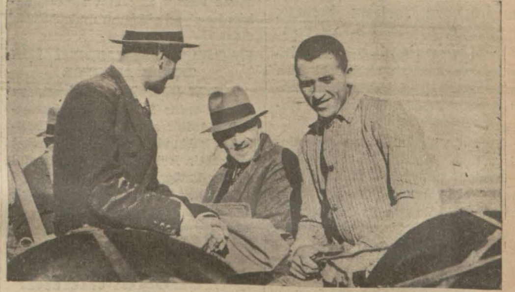
Adliye vekili bir mahkûmun sürdüğü arabasında giderken

Vekilin şerefine temsiller verildi, güreşler yapıldı. Adada bir gün hapis iki gün sayılacak