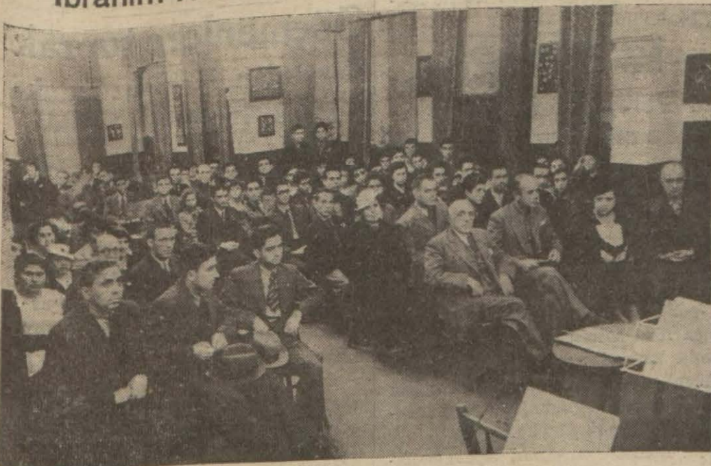
Dün Halkevinde yapılan merasimde hazır bulunanlardan bir grup

Halkevlerinde büyük merasim yapıldı, İbrahim Necminin nutku radyoda dinlendi