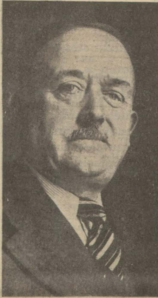
Frangın düşürülmesi kararını verenlerden Fransız maliye nazırı M. Vincent Aurio

frangın düşürülmesi meselesi hakkında dün bir muharririmize şunları söylemiştir: