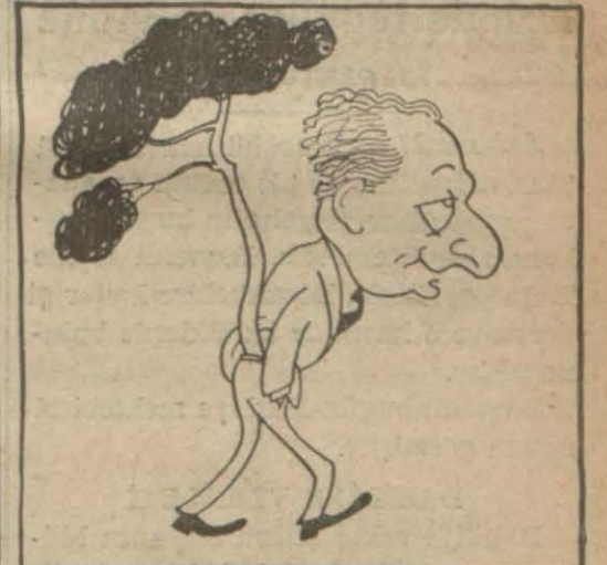
Faruk Nafiz ÇAMLIBEL