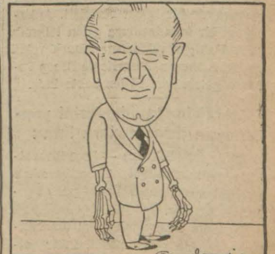
İskender Fahreddin SERTELLİ