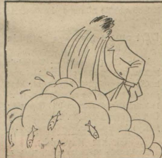
Behçet Kemal ÇAĞLAR