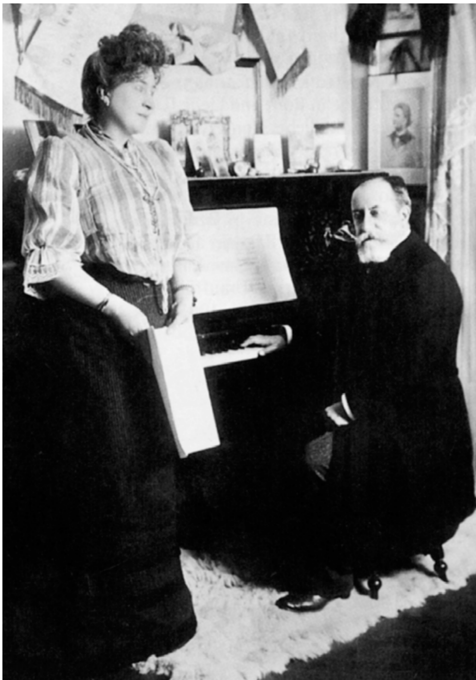
Saint-Saëns tijdens een repetitie met een zangeres, 1902

Geleidelijk aan vond echter ook het pianotrio zijn weg naar de concertzaal. In Frankrijk werd Camille Saint-Saëns als de pionier van het genre beschouwd. In de literatuur wordt hij vaak als de eerste Franse componist gezien, die zich - binnen het genre van de kamermuziek - competitief tegenover zijn Duitse voorgangers kon opstellen. Ook binnen Frankrijk is zijn invloed niet gering. Maurice Ravel, bijvoorbeeld, componeerde zijn Pianotrio naar het model van het Eerste Pianotrio van Saint-Saëns.