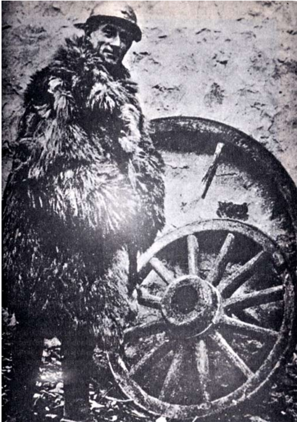
Ravel als vrachtwagenchauffeur aan het front bij Verdun, 1916