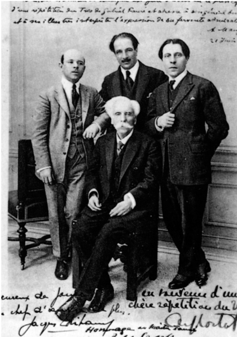
G. Fauré (zittend) met v.l.n.r. P. Casals, J. Thibaud en A. Cortot, een van de eerste trio's die Fauré's Pianotrio uitvoerden.

ling tussen de gesyncopeerde staccati in de piano enerzijds met de pizzicati in de strijkers anderzijds. In het laatste deel maakt Saint-Saëns gebruik van enkele traditionele compositorische technieken, zoals de fugatische schrijfwijze, die ook in de trio's van Schumann en Mendelssohn voorkwamen. Toch combineert hij deze techniek met een zekere elegantie, typisch voor de Franse muziek.