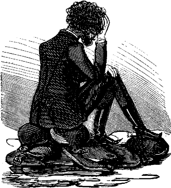
Visieu Guleru ca unu nou Mariu plange in departare pe ruinele — celoru dóue mâji de clisa.