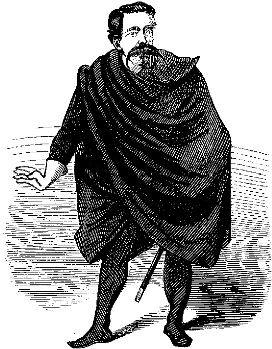
Richardu Puscastele : O tíera pentru unu mandatu de deputatu !