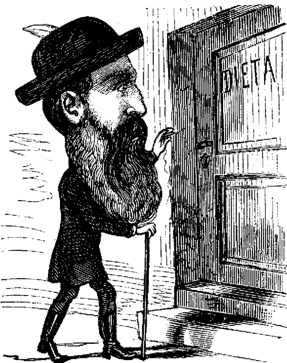
Zsiga bátsi : Sê intru séu sê nu intru? Me ducu susu in galeria !