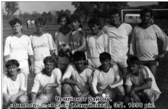
Чемпіонат району. «Вимпел» — «Псел» (Мануйлівка), 3:1. 1990 рік.