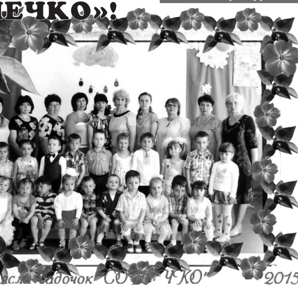
Дитячий садочок «СОНЕЧКО» 2015

За вимогою часу кожен дошкільний навчальний заклад повинен мати комп'ютер, принтер, підключення до мережі Інтернет. Завдяки шановним керівникам «Метекс-Агро» у нашому закладі з'явилася комп'ютерна техніка. Маємо надію, що за їх сприяння у дитячому садку «Сонечко» з'явиться Інтернет, буде свій сайт і вся Україна зможе переглядати новини з нашого ДНЗ. Дошкільний заклад росте, незабаром «Сонечку»