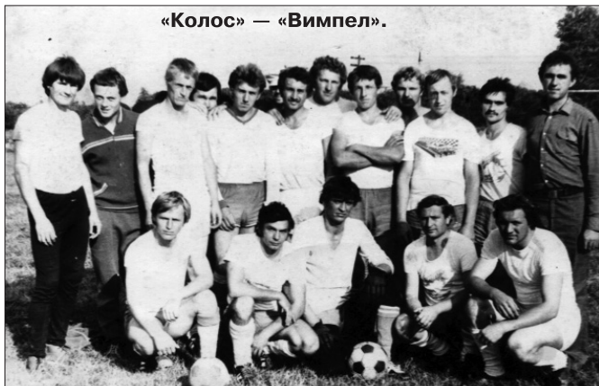
«Колос» — «Вимпел».