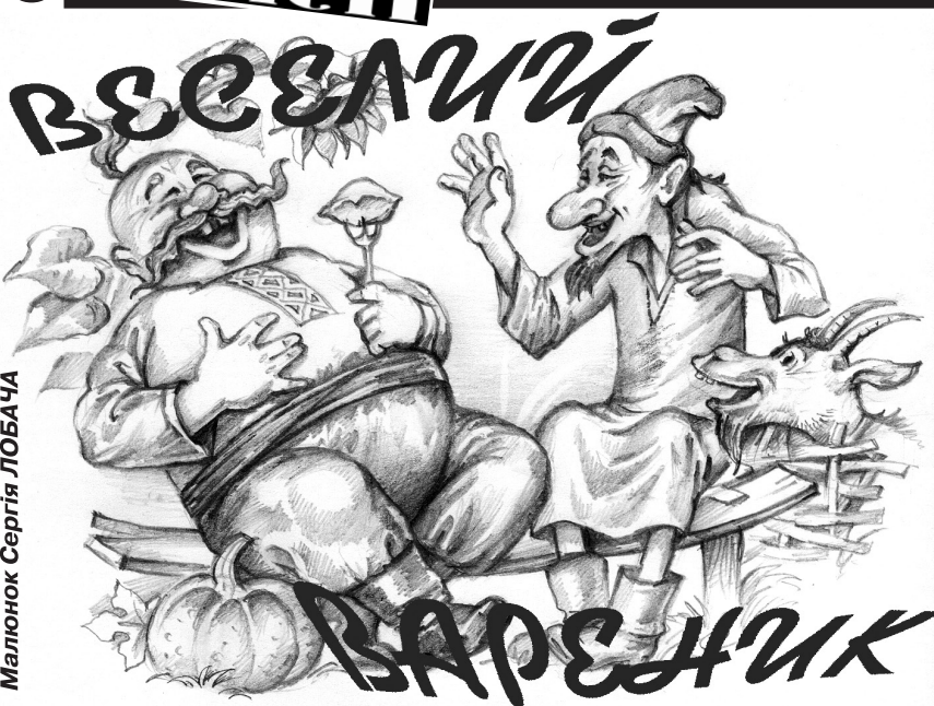
Малюнок Сергія ЛОБАЧА