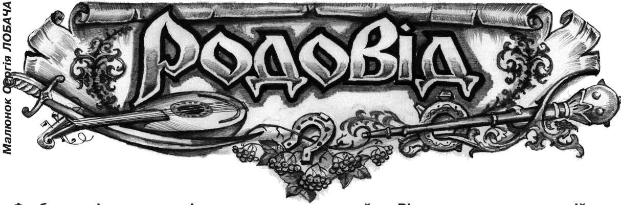
Малюнок Сергія ЛОБАЧА