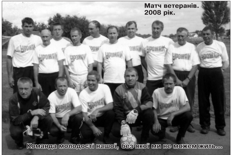
Матч ветеранів. 2008 рік.