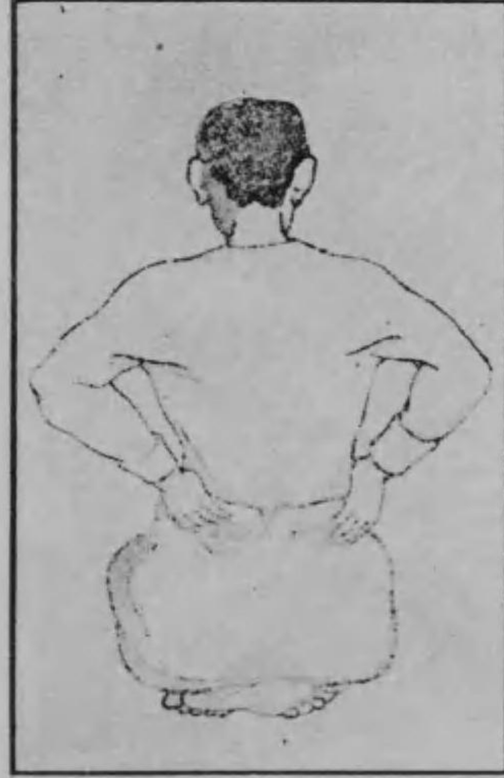
圖四第 す壓てれ入を力に田丹、て立く堅を柱脊