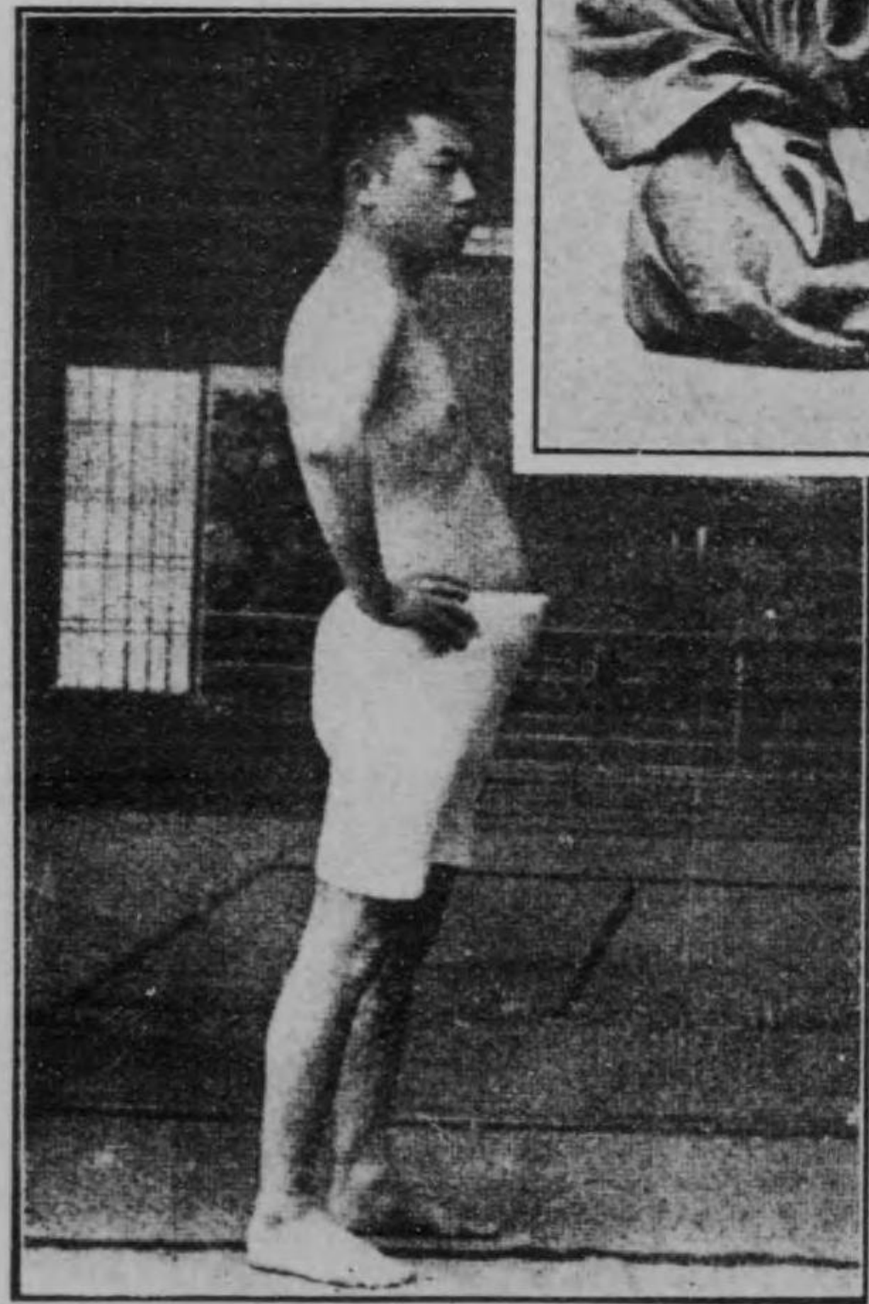
田丹の者著前年五