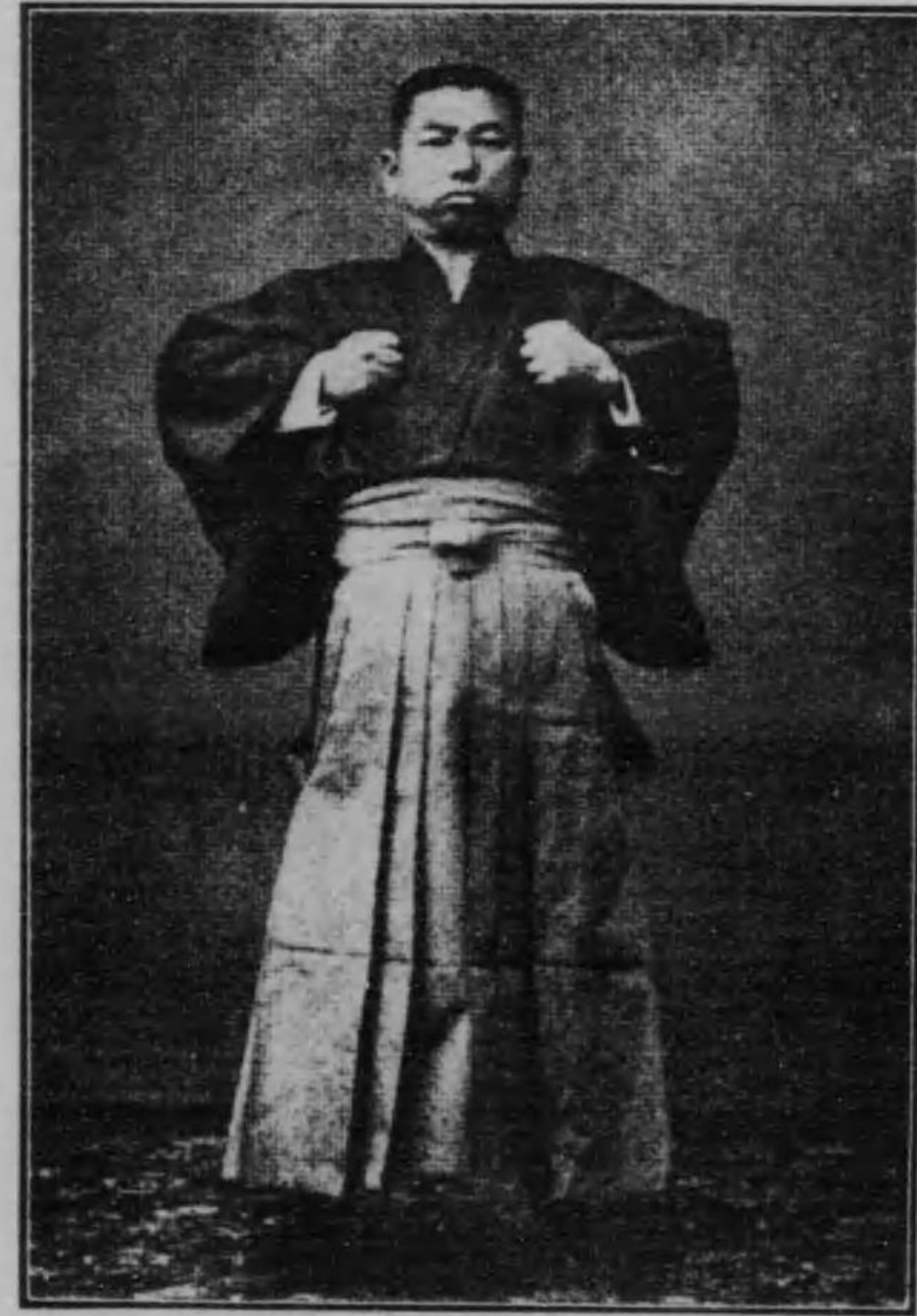
照參章九第ろこふ行を禪魂本日者著前年五

身心堅固の此肉は 日本魂の結晶ぞ 三千年を一貫し 不生不滅に相續す 豊太閤も楠公も 興國維新の勲業も 今現在の我國の 我等が肉に備るぞ 身心堅固の此肉は 日本魂の結晶ぞ