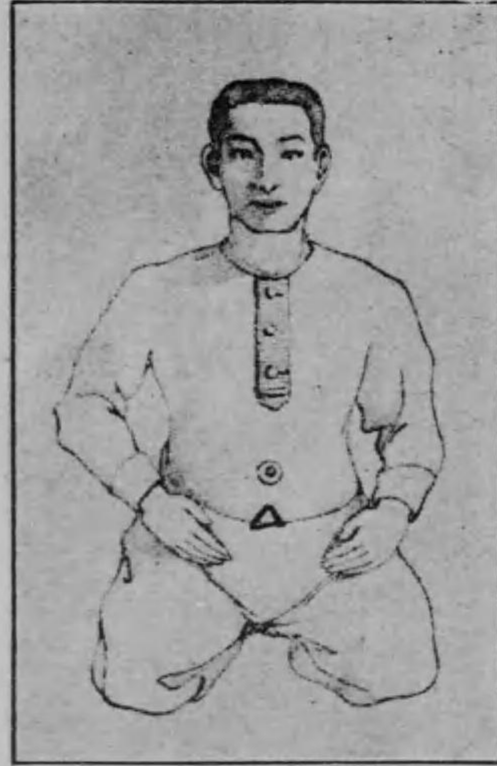
圖三第 す壓を腹てれ入を力に手てれ入を力に田丹