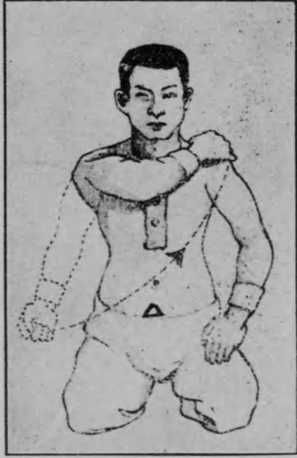
圖一第 つ打を肩てれ入を力に田丹