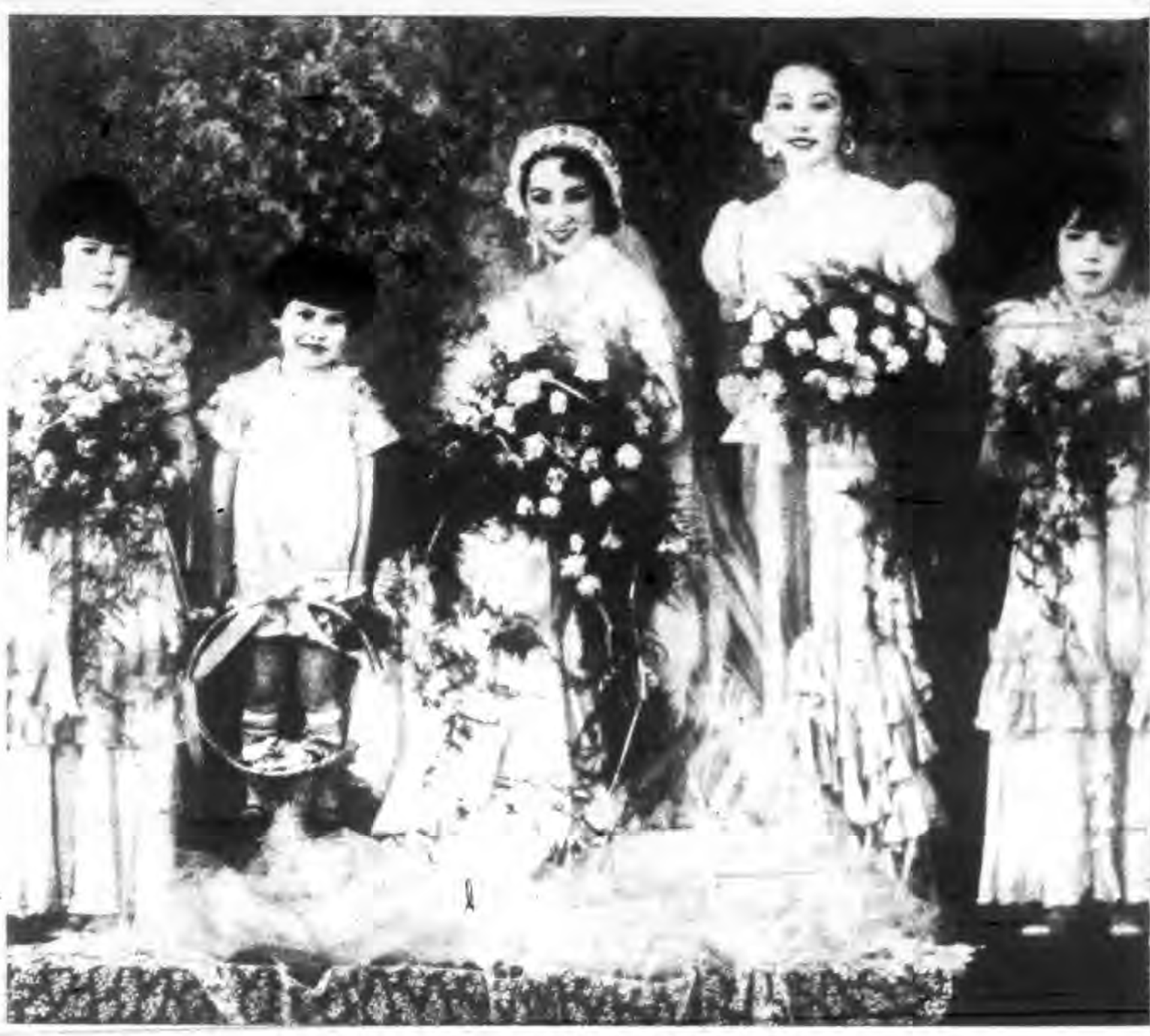
婚結君元經李生醫牙與近士女寶家袁