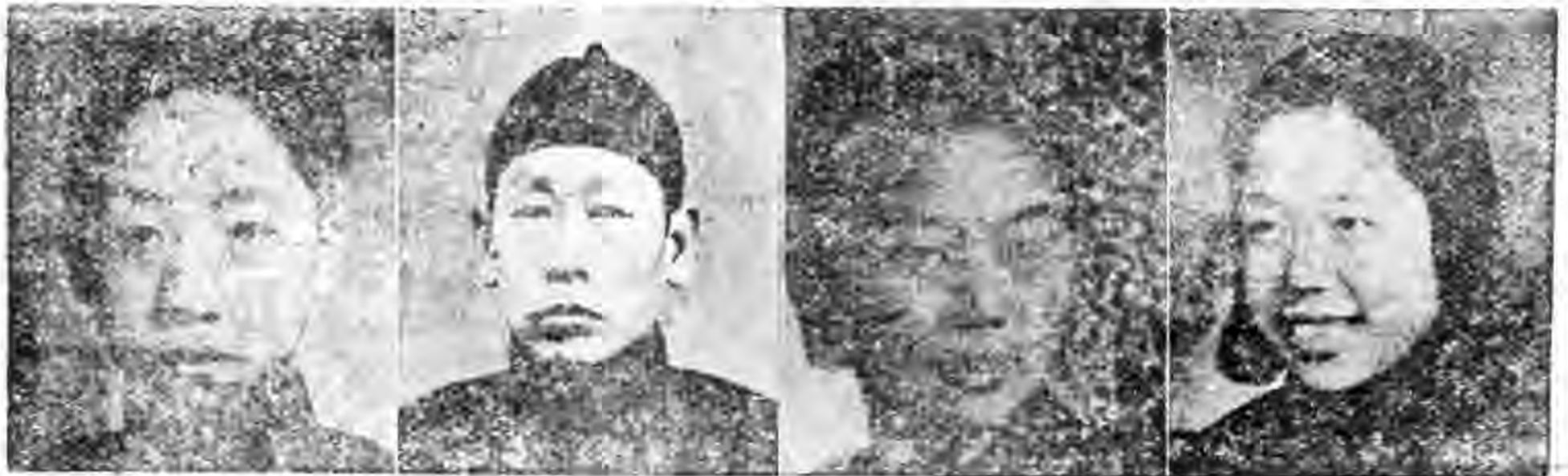
社柱砥醫國 社柱砥醫國 社柱砥醫國 社柱砥醫國 長社社分進武蘇江 長社社分村李北河 長社社分州杭江浙 任主務總社滬 年 鶴 錢 德 全 王 因 嘉 張 之 明 錢