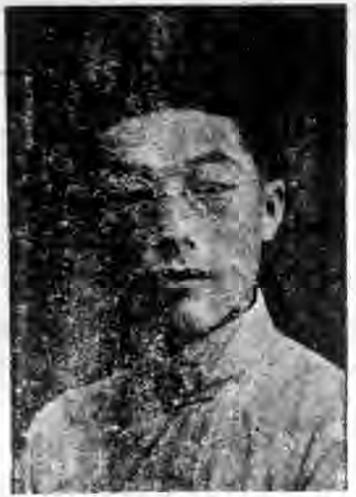
(本社社長兼總編輯近影)