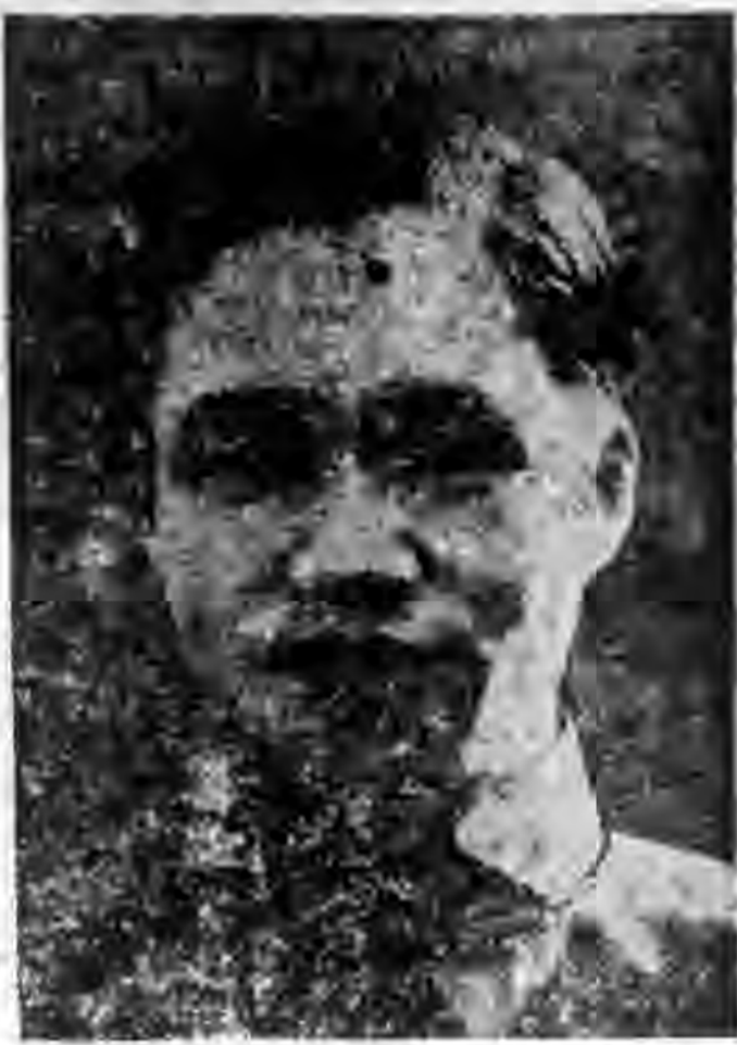
(本社董事兼總經理近影)