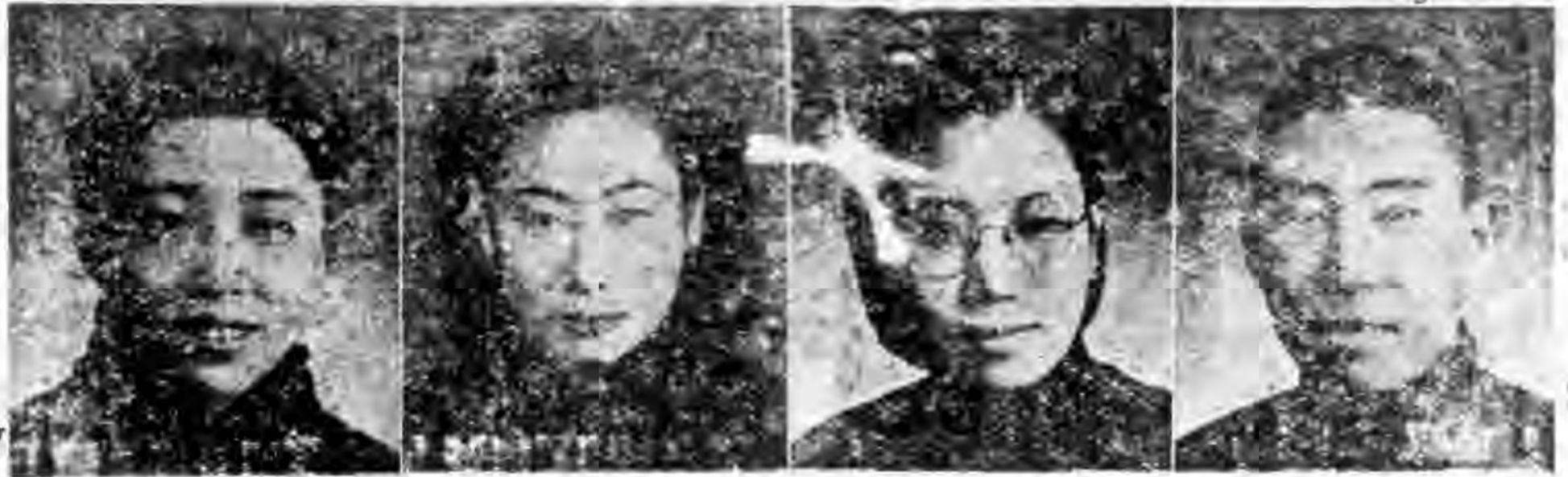
長社副社醫女國中 輯編社學醫女國中 事理譽名館醫國央中 院學醫國中 新海上 輯編總兼 書秘會事董社本 長社社學醫女國中 授教院學醫國中 霞 靜 張 如 鑑 高 華 寶 錢 玄 公 錢