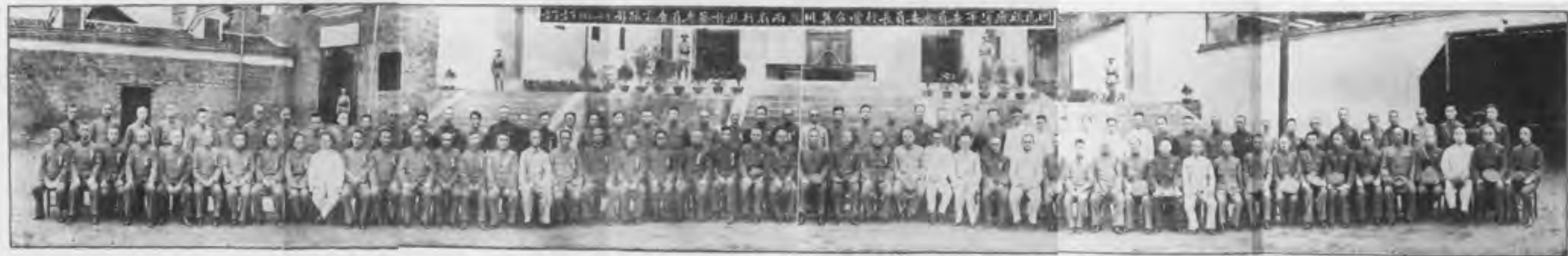
1937年11月，八路军在山西临汾县合影。前排为八路军总司令部成员，后排为临汾县各界人士。