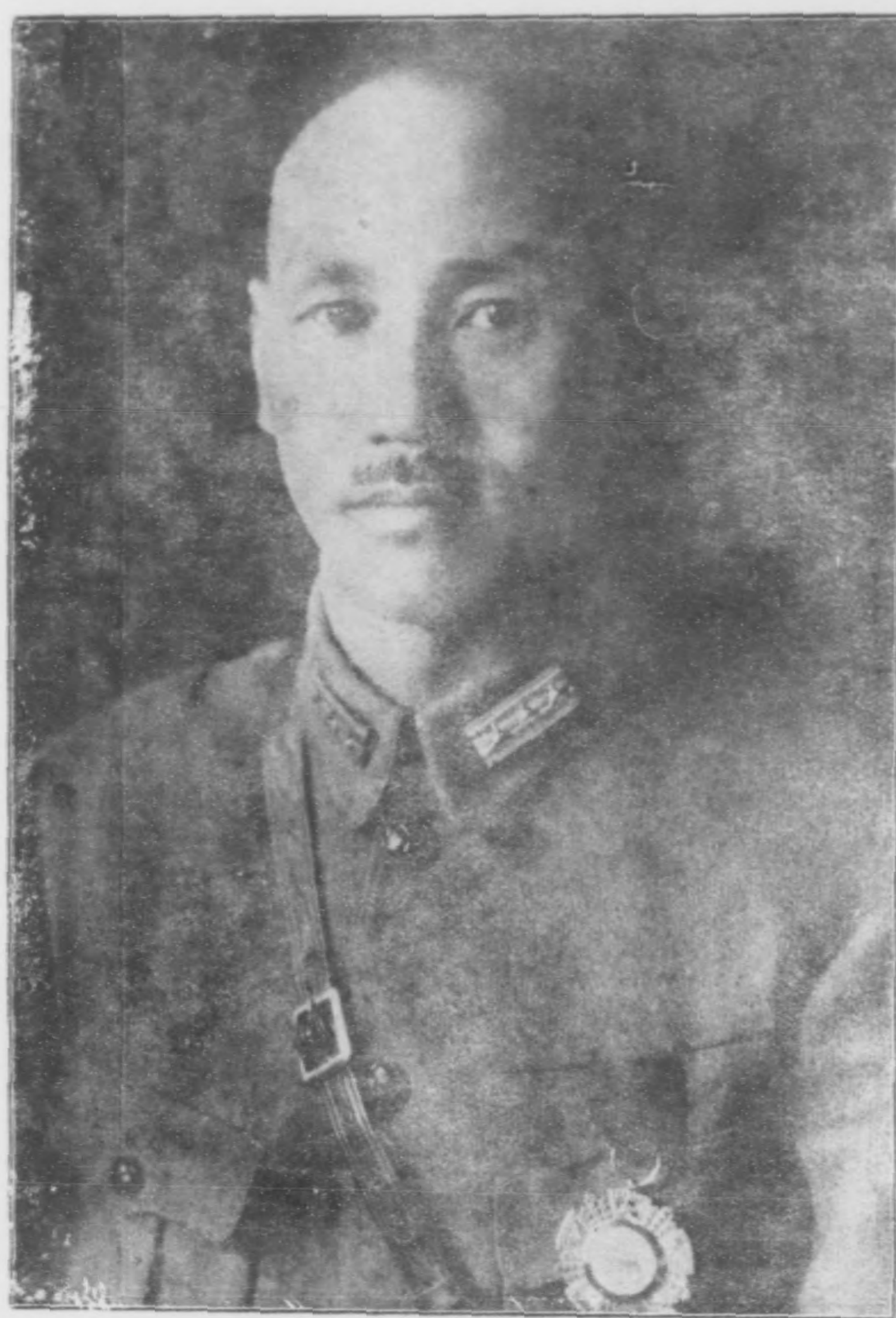
委 員 長 近 影