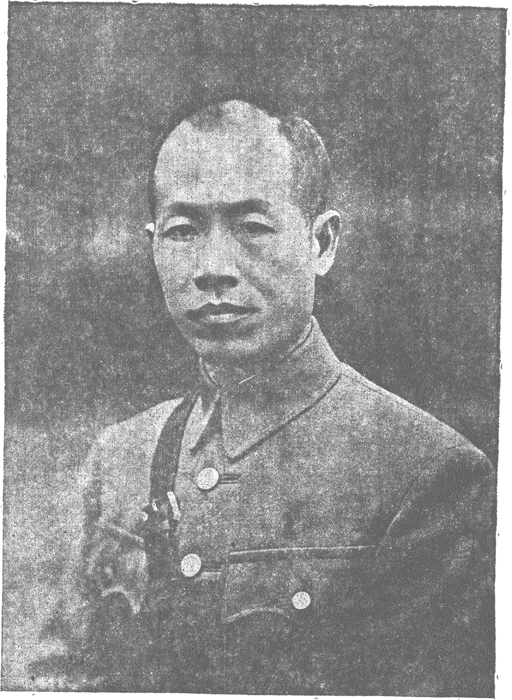
李 主 席 玉 照