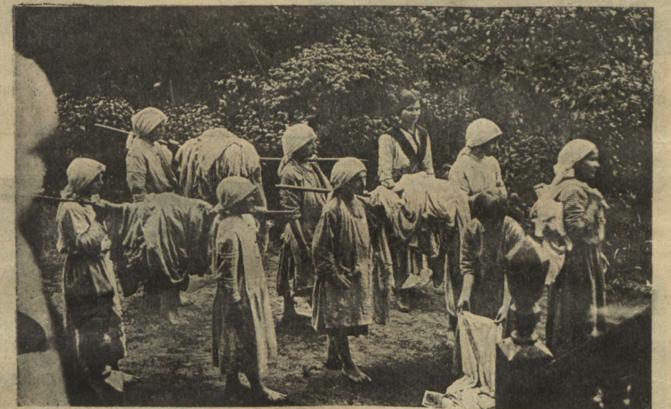
Дѣти переносятъ бѣлье на рѣчку.