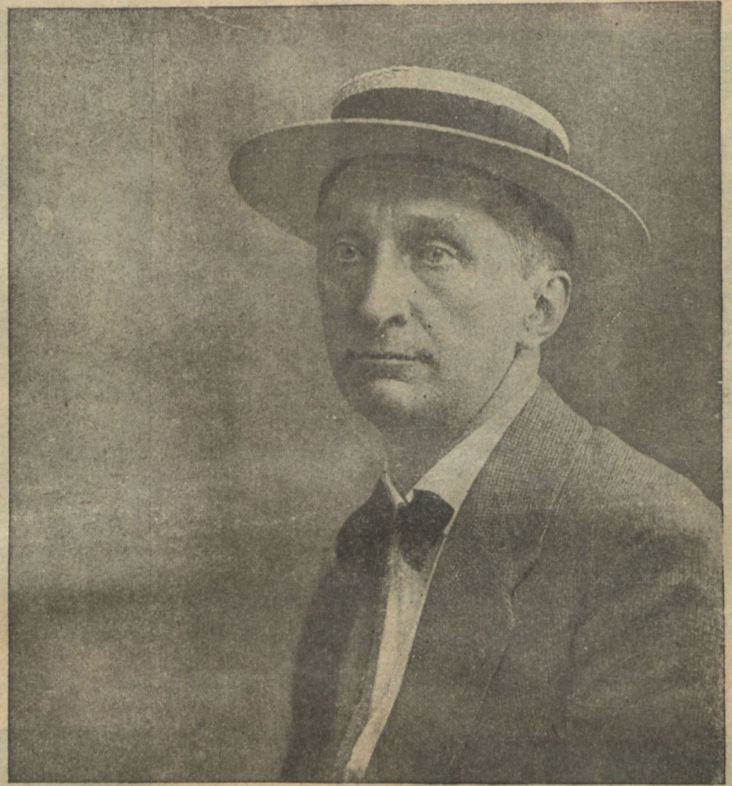
Максимиліанъ Венгринъ, извѣстный польскій режиссеръ, на-дняхъ скончавшийся въ Москвѣ.