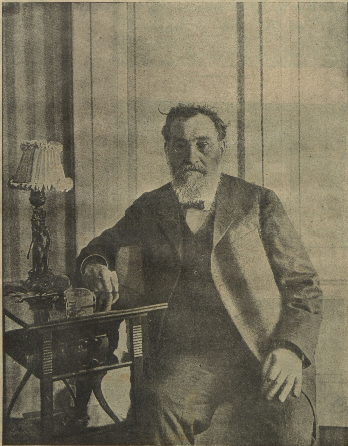
Илья Ильичъ Мечниковъ. Скончался 2-го іюля 1916 года въ Парижѣ.