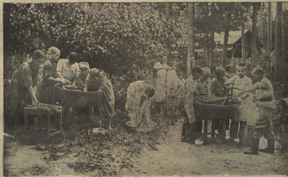
За мойкой бѣлья.