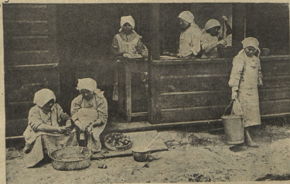
Дѣти готовятъ обѣдъ.