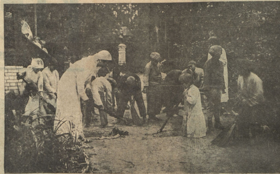
Дѣти очищаютъ садъ.