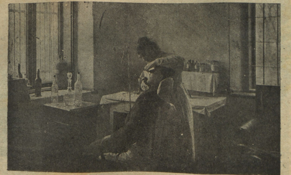
Зубоврачебный кабинетъ на позиціи.