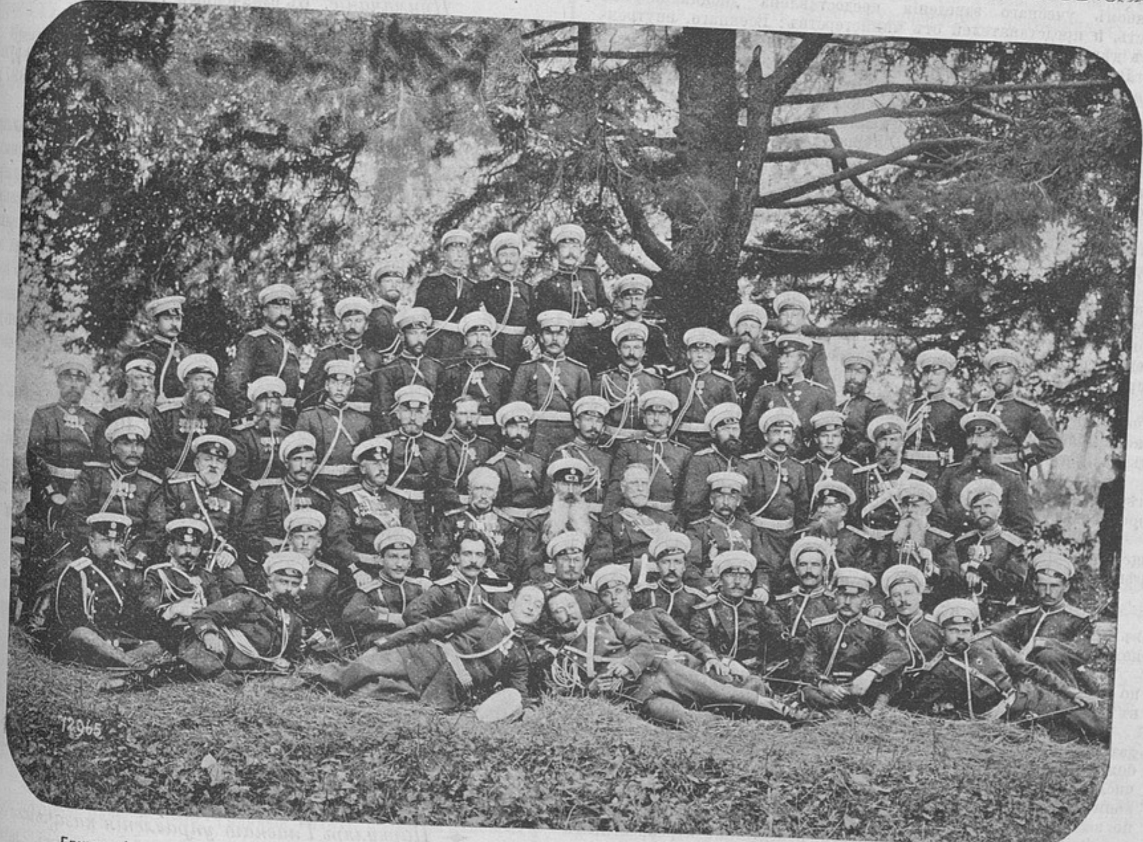
Група офицеровъ 10-го пѣх. Новоингерманландскаго полка (къ статьѣ «Новоингерманландскій полкъ на маневрахъ»).

При этомъ № 477 „Развѣдчика“ прилагается бесплатно для всѣхъ под- писчиковъ за 1899 г. „Изборникъ Развѣдчика“, книга XIV. Экземпляры сданы почтамту одновременно для всѣхъ годовыхъ подпис- чиковъ, а потому не получившіе означеннаго приложенія благоволятъ не- медля сообщить объ этомъ въ редакцію, для заявленія почтамту.