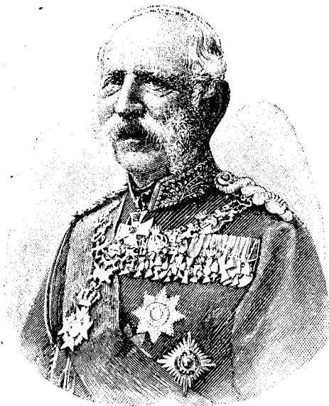
ALBERT REGELE SAXONIEI.

— Pe ăsta ți-l lăsăm ție, greule; mai fă din el