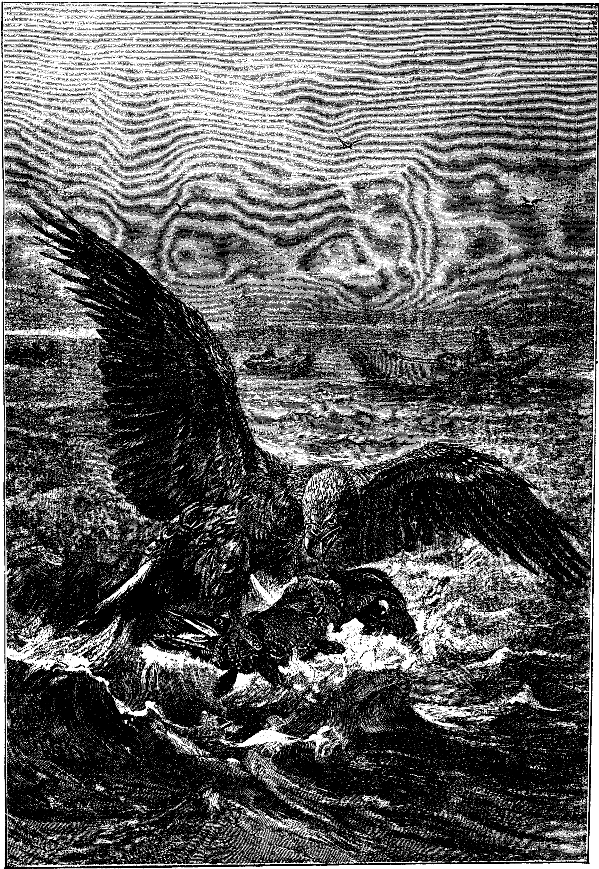
H O T D E M A R E .