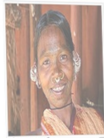
ଓଡ଼ିଆରେ ଗଢ଼େ ଥିବା ଅନୁସୂଚିତ ଜାତି