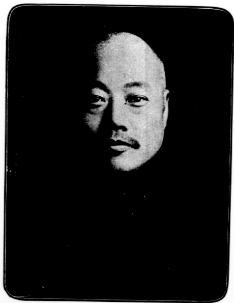
宋 員 委 長