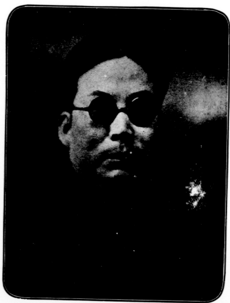
熙 哲 鄧 長 院