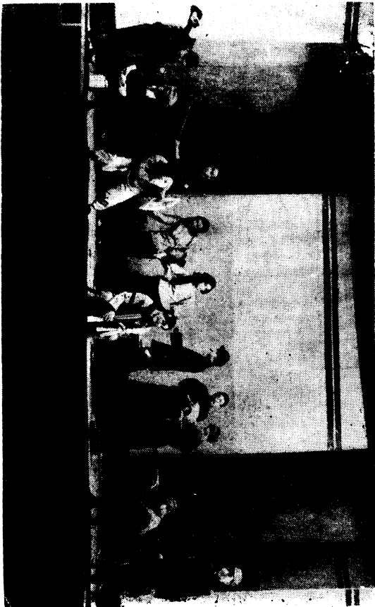
打倒日本昇平舞(舞台面之一)