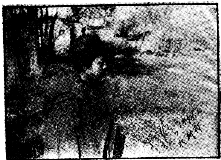
丁玲同志（一九三八年一月攝）