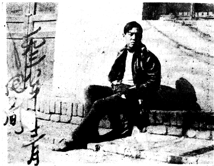
本書著者（一九三八年三月攝）