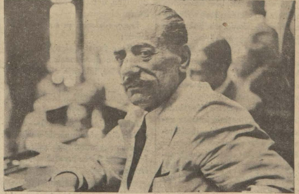
M. Çaldarisi, kralcılara iltihak ettirmek için, icabında kabineden çekileceği söylenen general Kondilis

M. Çaldarisi bitarafılıktan caydırmak için nümayişler yapacaklar, bu tedbir netice vermezse Kondilis istifa edecek