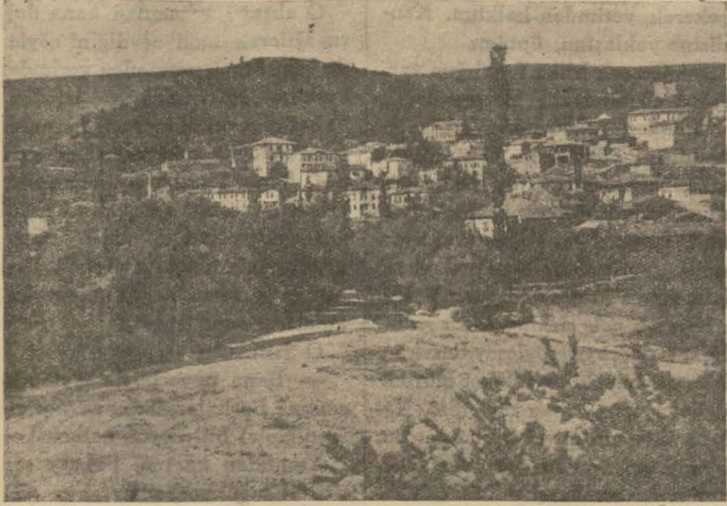
Havzadan bir görünüş

Bu tesisat için 150,000 lira harcanacağı söyleniyor, Havza kaplıcalarına bu yıl rağbet fazladır