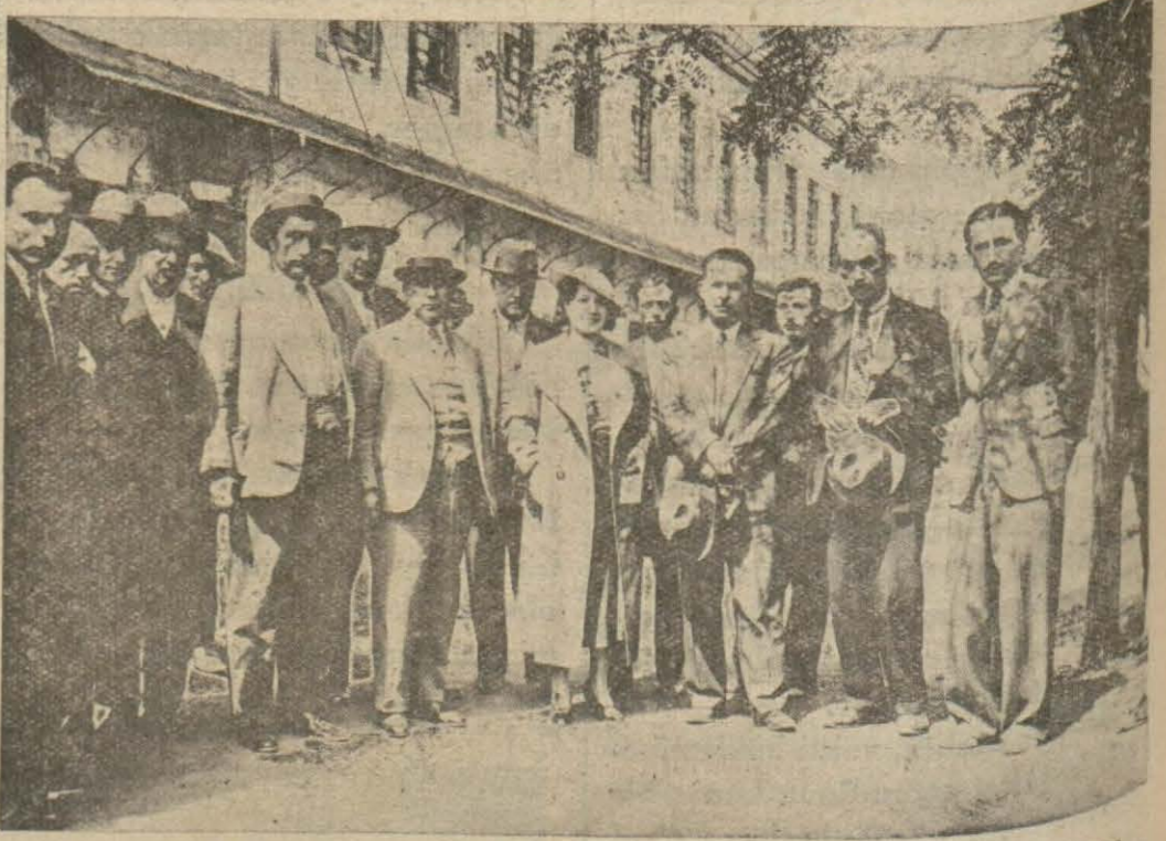
Trabzon sayıyları Trabzon ve kazalarında tetkiklerine devam ediyorlar. Resmimiz tetkik seyahatı yapan sayıyları bir arada gösteriyor.