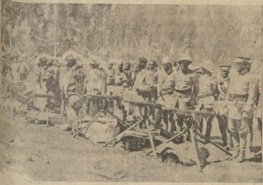
Muntaza askerlerle Habeş aşiretleri mitralyöz talimi yaparken

Bolzano 31 (A.A.) — M. Musolini her türlü ihtimallere karşı gelmek için yeniden iki yüz bin İtalyanın eylülde silâh altına çağırılacağını, askerî kıtalar tarafından yapılan büyük geçid resminde verdiği söylevde bildirmiştir. Manevralara iştirak eden kıtaların fırkalarıyla birlikte kalacaklarını ilâve