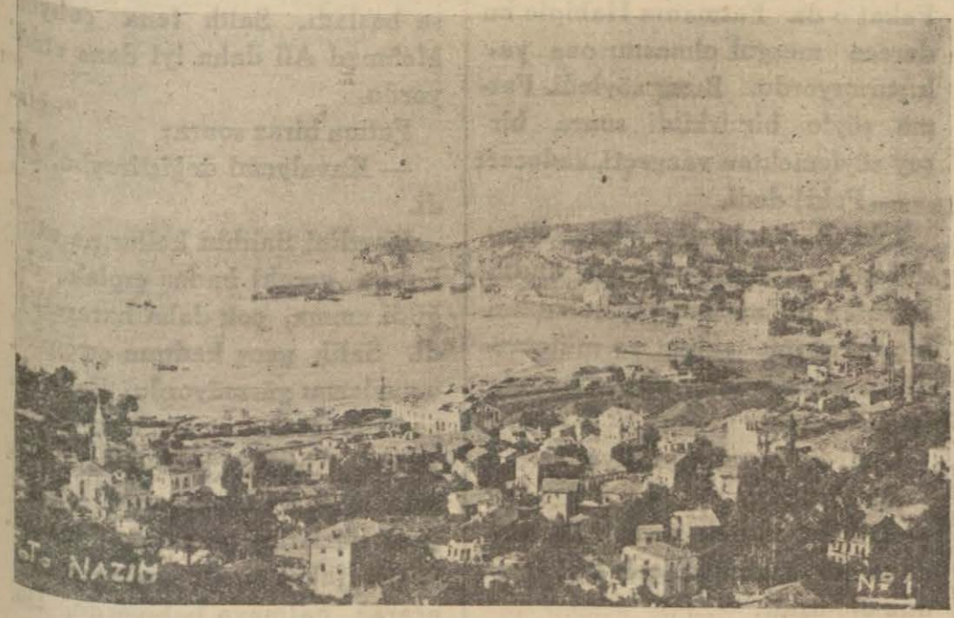
Zonguldaktan bir görünüş

Inebolu sahili, çok güzel... İnce, nazik bir güzellik Her taraf ta kıyıya kadar ağaçlıktır. Bunların arasında seyrek, ahşap ve boyasız evler var