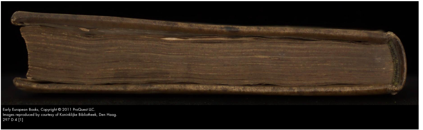
297 D 4 [1]