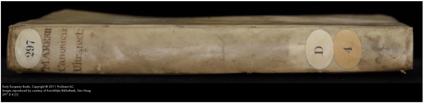
Early European Books. 297 D 4 [1]