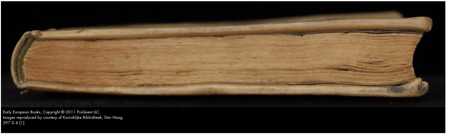
Early European Books, Copyright © 2011 ProQuest LLC. Images reproduced by courtesy of Koninklijke Bibliotheek, Den Haag. 297 D 4 [1]