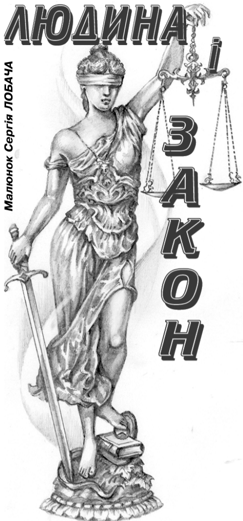
Малюнок Сергія ЛОБАЧА