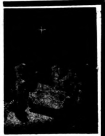
懺悔 · 白人。

「多謝你贈給我的金錢和遺點真心，但我的真摯和愛情却不是金錢能買得到的，現在還給你吧！但我又想到我沒有學到世間的種種味道的以前，我是不情願就那樣死去的。」