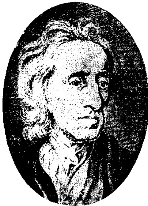
John Locke (1632-1704)