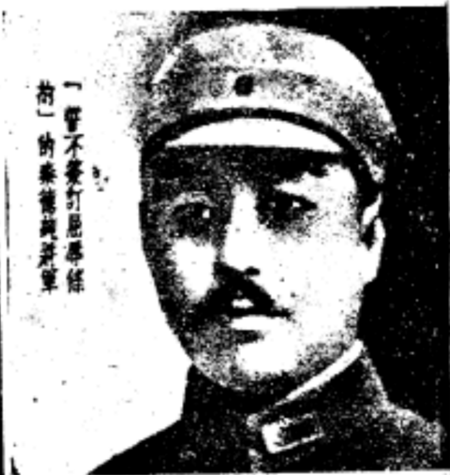
「誓不簽訂屈辱條 約」的秦德純將軍