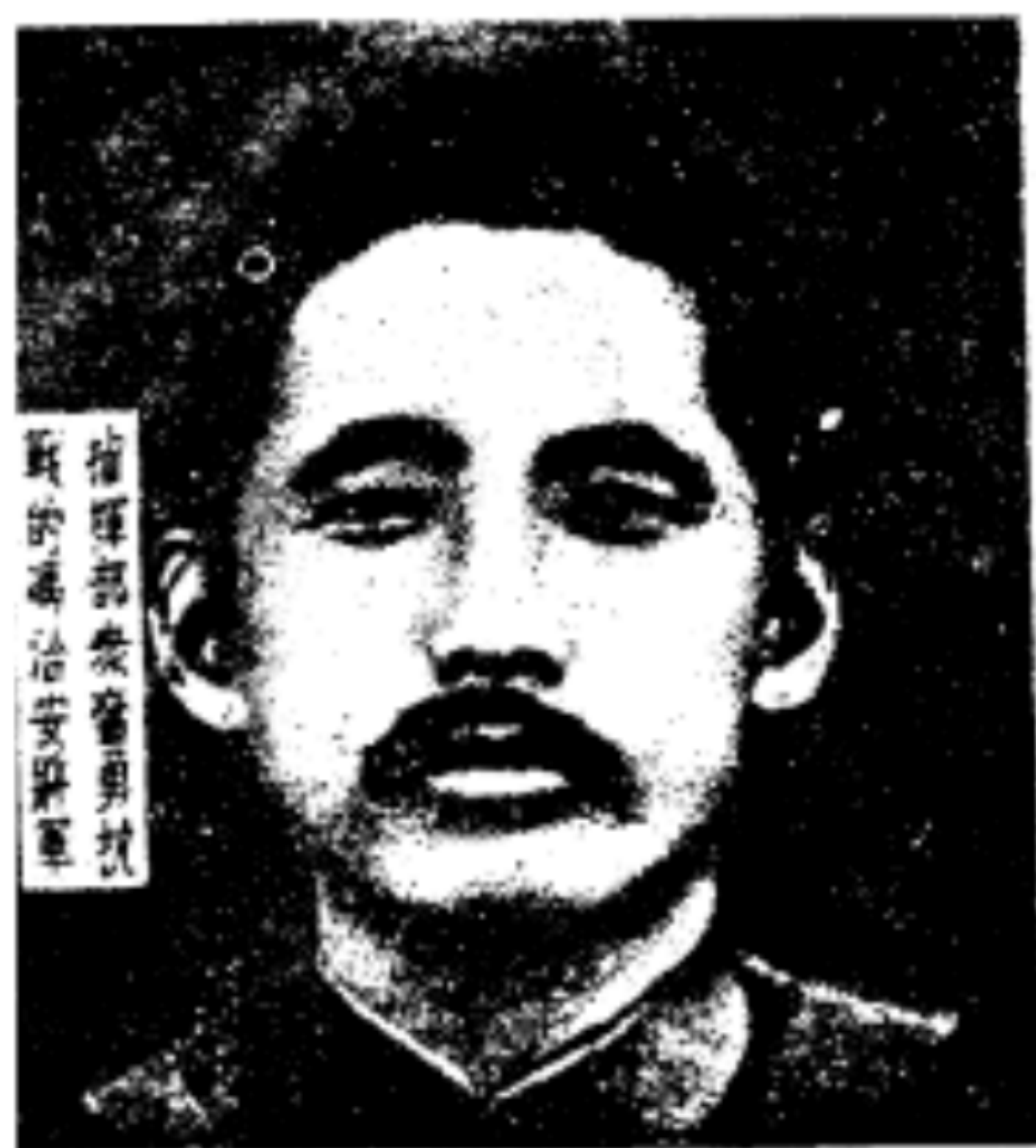
指揮部裝備勇抗 敵的馮治安將軍