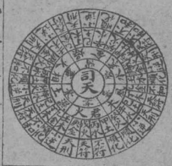
圖臨相下上氣運年十六

乙酉運氣皆水丙辰丙戌六十年中有此十二年運氣相同皆天符也雖曰同氣不無偏勝亢富其太乙天符歲會等年另詳在後起主客定位指掌歌○掌中指定司天中指根紋定在泉順進食指初二位四指四五位推傳司天即是三氣位在泉上氣位當然主以木火土金水客以陰陽一二三 註 左手仰掌以中指上頭定司天之位中指根紋定在泉之位順進食指三節紋定初之氣位頭節紋定二之氣位中指上頭定三之氣位即司天之位也第四指頭節紋定四之氣位二節紋定五之氣位中指根紋定六之氣位即在泉之位也主氣以木火土金水者五氣順布之五位也故初之氣厥陰風木二之氣少陰君火三之氣少陽相火四之氣太陰濕土五之氣陽明燥金六之氣太陽寒水是木生火火生土土生金金生水水復生木順布相生之序一定不易者也客氣以一二三名之者三陰三陽六氣加臨也故厥陰為一陰少陰為二陰太陰為三陰少陽為一陽陽明為二陽太陽為三陽是一生二二生