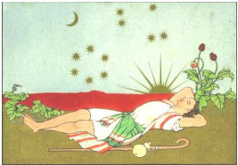
Owen Jones, ilustracja z książki The History of Joseph and His Brethren , domena publiczna