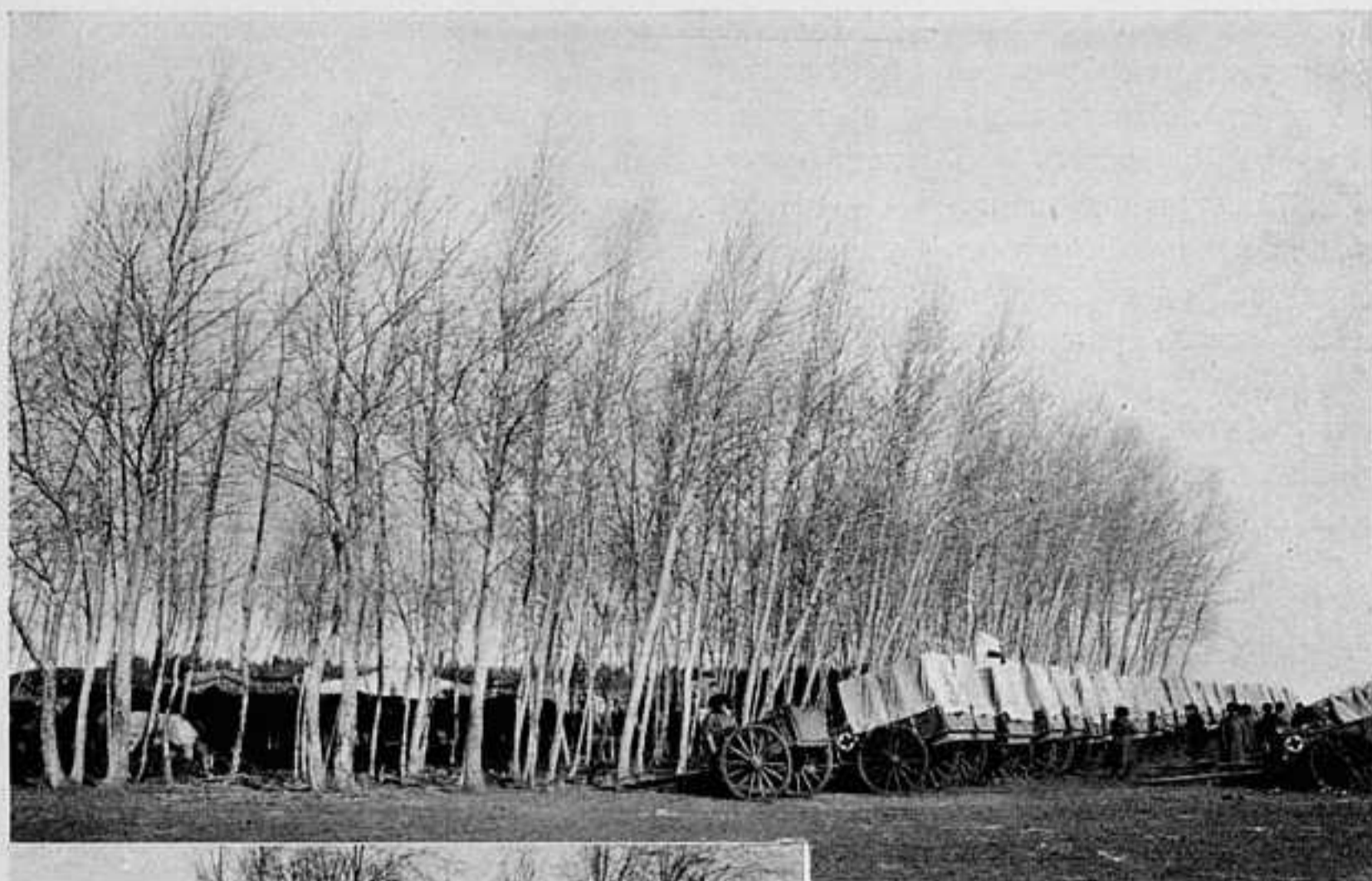
ВОЕННО-САНИТАРНЫЙ ТРАНСПОРТЪ НА ОТДЫХЪ.