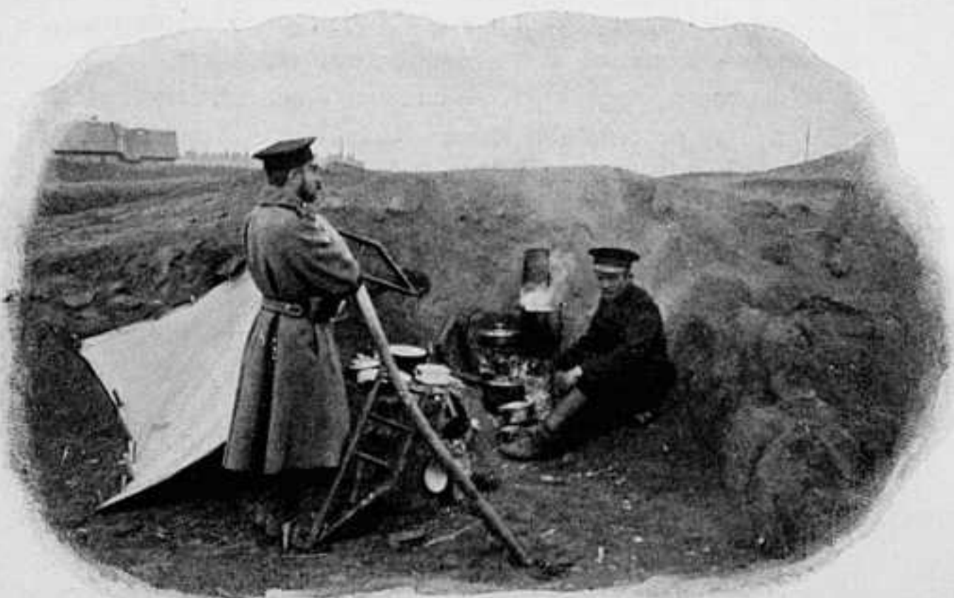
КУХНЯ КОМАНДИРА 4-ГО АРМЕЙСКАГО КОРПУСА. По фотографіи W. K., съ театра войны.

7—20 августа. Угромъ ст.-секр. Витте и баронъ