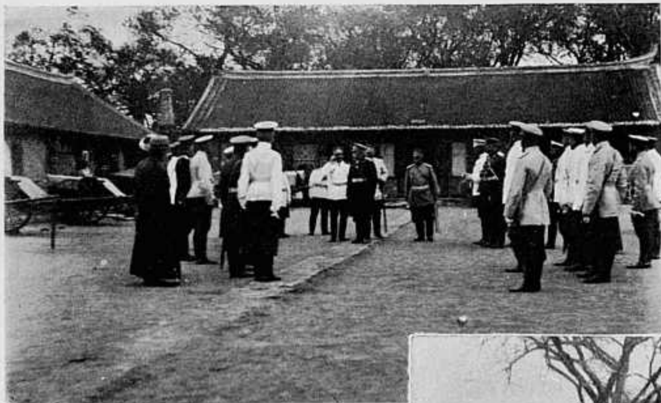
ПОСѢЩЕНІЕ ГЕН. ЛИНЕВИЧЕМЪ ШТАБА 1-Й МАНЬЧЖУРСКОЙ АРМІИ ВЪ ДЕР. СЫТЕЗА.