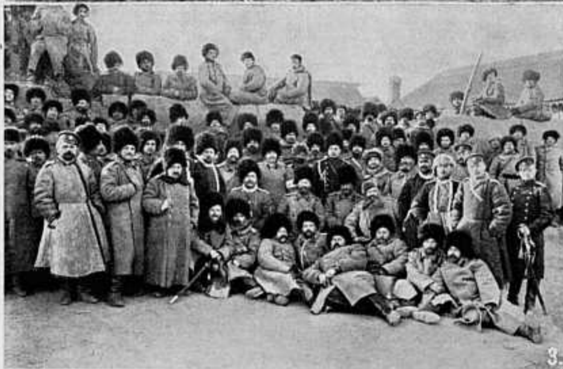
группы офицеровъ полковъ 41-й пѣх. дивизіи. 1. 162-й ахалцухскій п. 2. 164-й закатальскій п. 3. 161-й александропольскій полкъ.