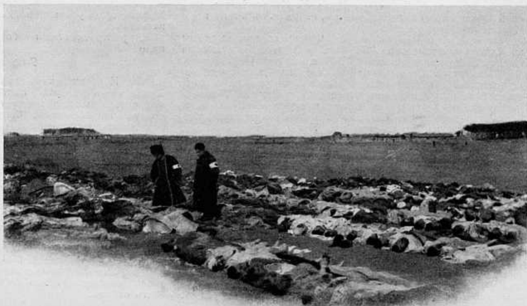
РЯДЫ УБИТЫХЪ У РУССКАГО КЛАДБИЩА ВЪ МУКДЕНѢ ПОСЛѢ БОЯ.

Въ приложеніи къ «Рус. Инв.» № 171 напечатанъ списокъ нижнихъ чиновъ убитыхъ, раненыхъ и пропавшихъ