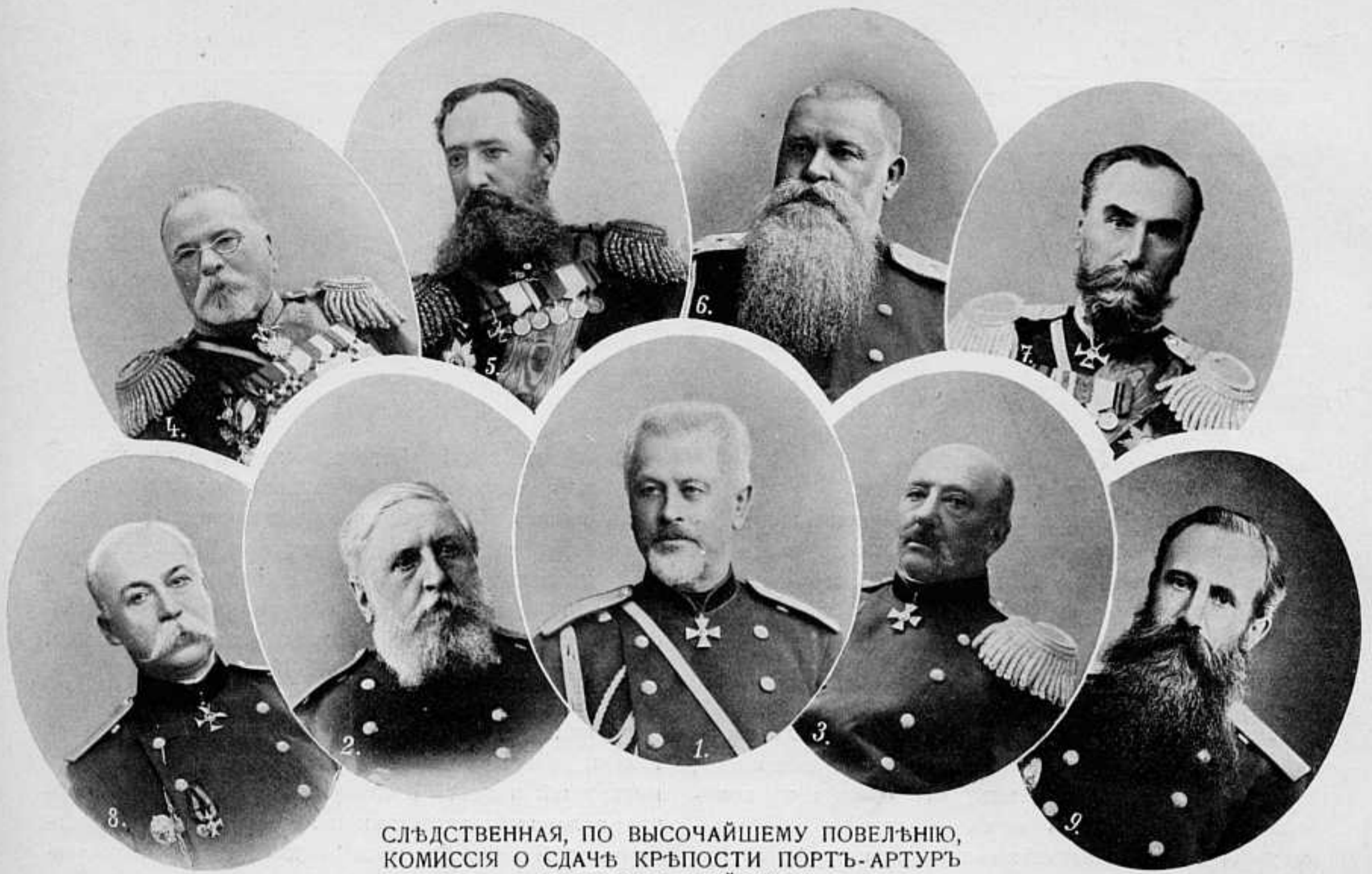
СЛѢДСТВЕННАЯ, ПО ВЫСОЧАЙШЕМУ ПОВЕЛѢНІЮ, КОМИССІЯ О СДАЧѢ КРѢПОСТИ ПОРТЪ-АРТУРЪ ЯПОНСКИМЪ ВОЙСКАМЪ.

1. Членъ Государств. Совѣта ген.-отъ-инф. Х. Х. Роопъ , предсѣдатель Комиссіи. 2. Членъ Государств. Совѣта инженеръ-генераль П. Ѳ. Рербергъ . 3. Членъ Военнаго Совѣта ген.-отъ-инф. К. В. Комаровъ . 4. Членъ Военнаго Совѣта ген.-отъ-арт. Н. А. Демяненковъ . 5. Предсѣдатель Виленскаго военно-окр. суда ген.-лейт. В. С. Митрофановъ . 6. Членъ Военнаго Совѣта, предсѣд. крѣпостнаго комитета ген.-лейт. Я. А. Гребенщиковъ . 7. Сенаторъ (бывшій началн. Александровской воен.-юр. академіи) ген.-лейт. Ф. Н. Платоновъ , членъ-дѣлопроизв. 8. Главный военный прокуроръ ген.-лейт. Н. Н. Масловъ . 9. Помощн. главнаго военнаго прокурора ген.-лейт. П. Ѳ. Лузановъ . Кромѣ означенныхъ лицъ, членами Комиссіи состоятъ ген.-отъ-арт. П. А. Крыжановскій , инж.-ген. Н. В. Богаевскій , вице-адмиралы И. М. Диковъ , А. А. Бирилевъ и ген.-адъют. Ѳ. В. Дубасовъ .