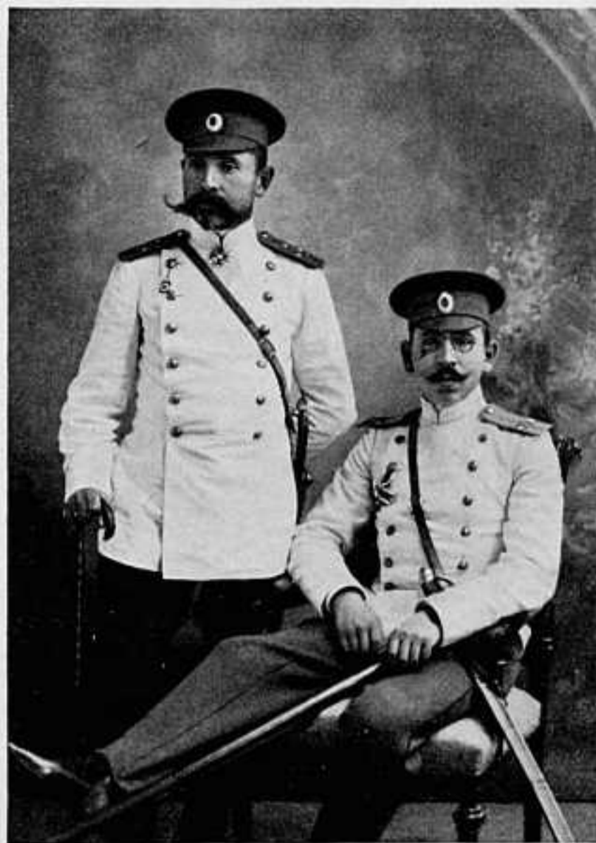
ОТЕЦЪ и СЫНЪ.

Откуда только взялись слухи о бунтахъ матросовъ. Будто матросы не хотѣли воевать, будто даже связали командировъ и самого Небогатова. Слухи эти не только не вѣрны, но даже прямо противорѣчатъ истинѣ. Наоборотъ,