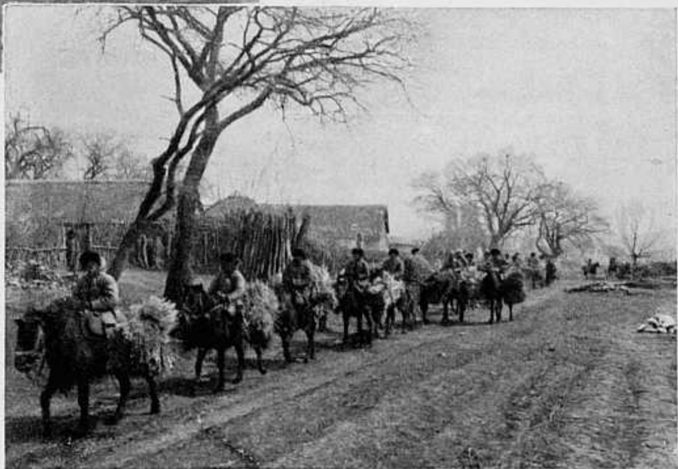
ВОЗВРАЩЕНІЕ СЪ ФУРАЖИРОВКИ.

Русскимъ уполномоченнымъ передано по телеграфу изъ Петербурга содержа-