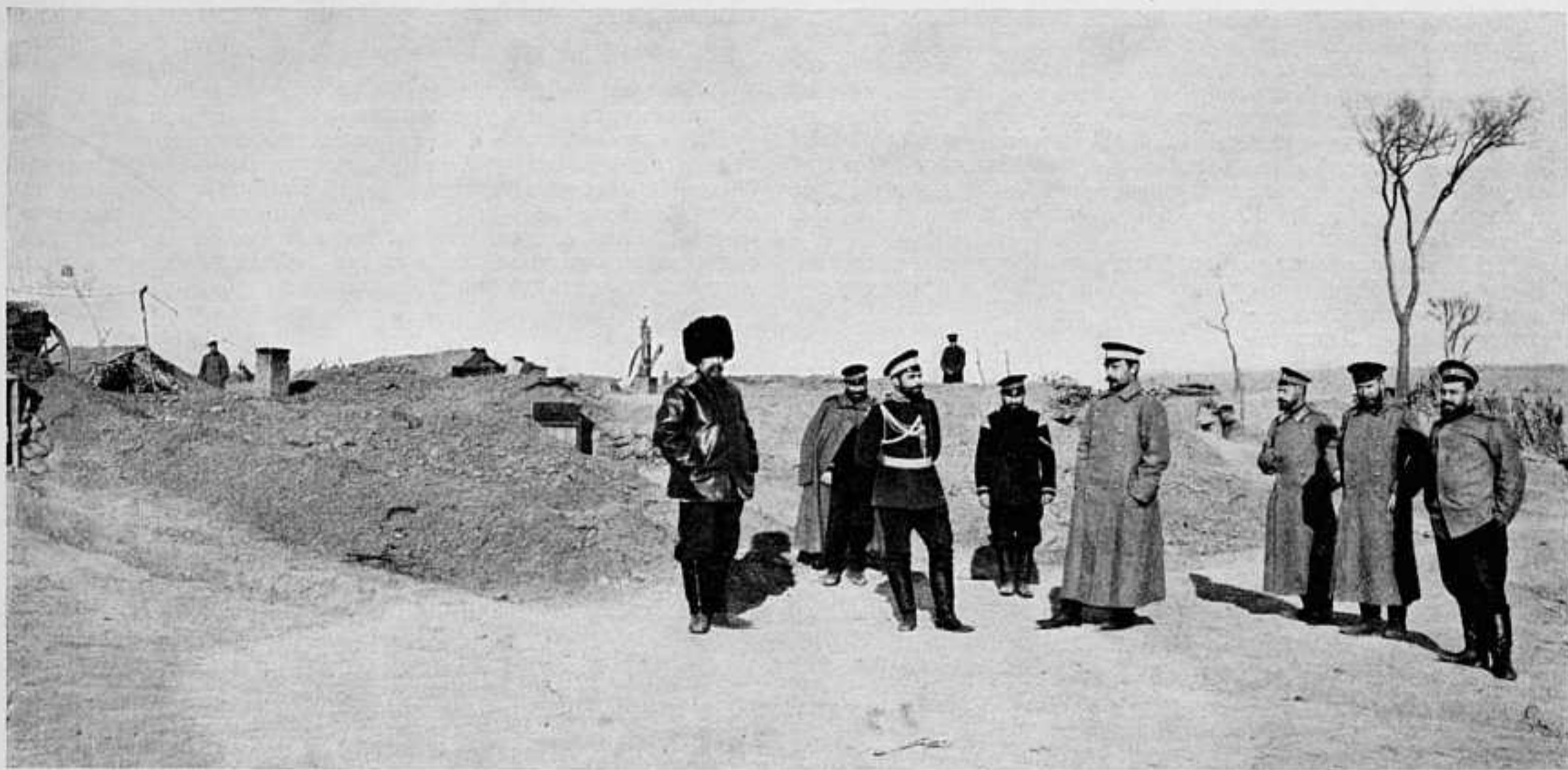
ОФИЦЕРСКІЯ ЗЕМЛЯНКИ 146-ГО ПѢХ. ЦАРИЦЫНСКАГО ПОЛКА, — ТАКЪ НАЗЫВАЕМЫЙ «НЕВСКІЙ ПРОСПЕКТЪ».