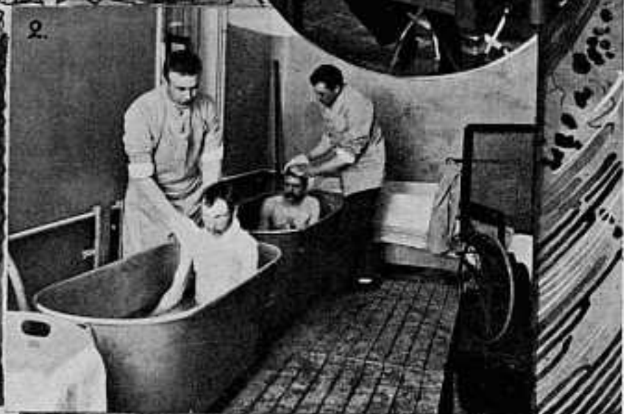
1. СЕСТРА МИЛОСЕРДІЯ ПРИНЦЕССА РЕЙСЪ. 2. ВАННАЯ. 3. СТАРШІЙ ВРАЧЪ. 4. ОФИЦЕРСКАЯ ПАЛАТА. 5. ПАЛАТА ДЛЯ БОЛЬНЫХЪ НИЖНИХЪ ЧИНОВЪ. 6. НАРУЖНЫЙ ВИДЪ ГОСПИТАЛЯ. 7. РАЗБОРНЫЙ БАРАКЪ. 8. ХИРУРГИЧЕСКАЯ ПАЛАТА.