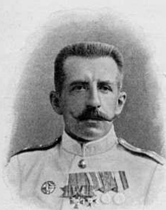
КАПИТАНЪ 2-ГО РАНГА П. Я. ДРЕШЕРЪ.

Былъ ст. офицеромъ на мин. транспортѣ «Енисей», взорвавшемся въ Портъ-Артурѣ 29 января 1904 г. Взрывомъ былъ сброшенъ въ воду. Послѣдствіемъ пребыванія въ ледяной водѣ въ теченіе нѣсколькихъ часовъ была тяжелая болѣзнь, отъ которой скончался 7 авг. сего 1905 г. За участіе въ военныхъ дѣйствіяхъ противъ Китая въ 1900—1901 гг. былъ награжденъ орденомъ св. Анны 3 ст. съ меч. и бант.; за отличіе въ бою съ японцами былъ награжденъ орденомъ св. Станислава 2 ст. съ мечами.