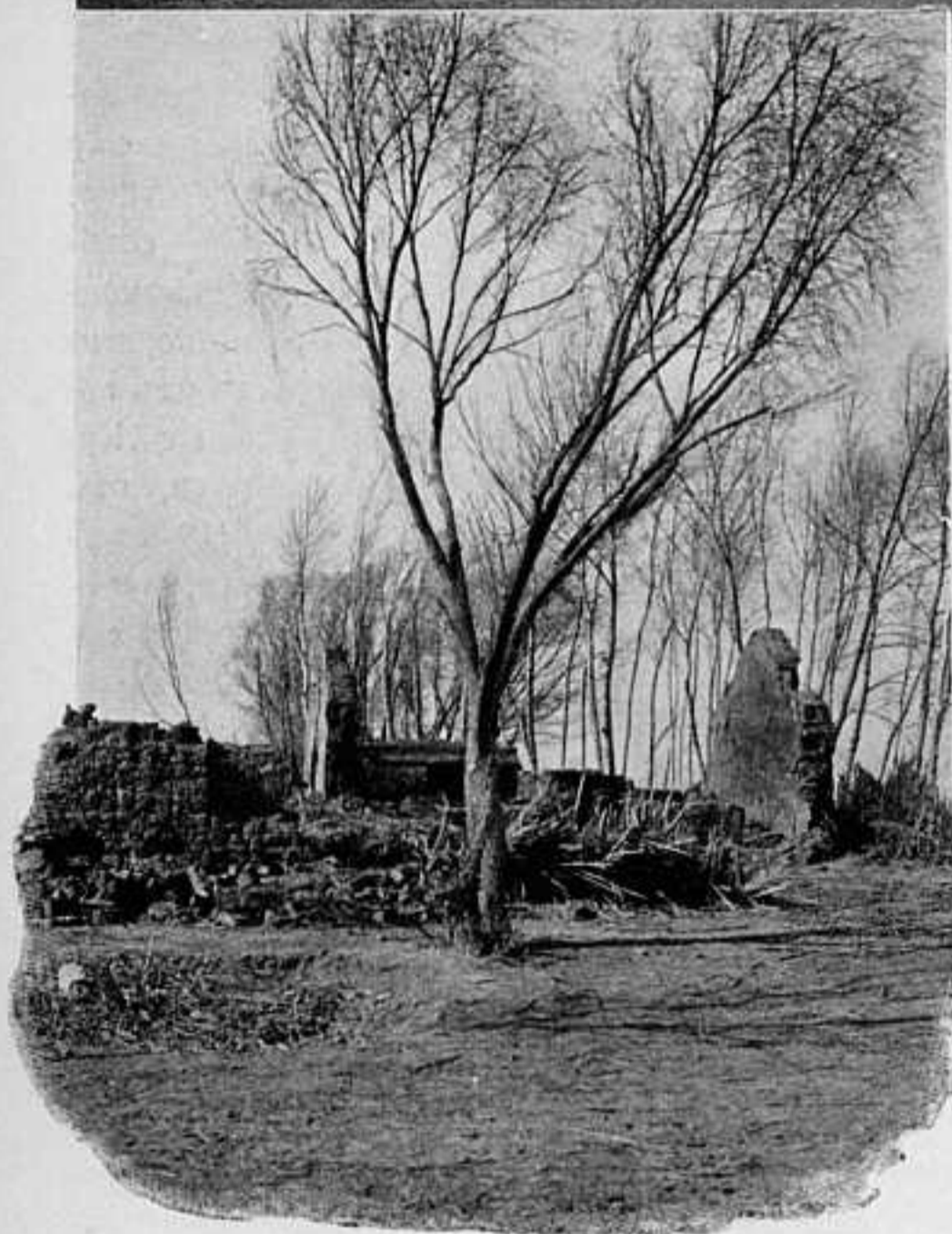
ОДНА ИЗЪ МНОГИХЪ ТЫСЯЧЪ РАЗЪРЕННЫХЪ И БРОШЕННЫХЪ ФАНЗЪ.