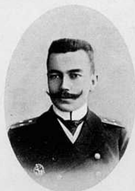
ЛЕЙТЕНАНТЪ БРОНЕНОСЦА «АДМИРАЛЬ НАХИМОВЪ».