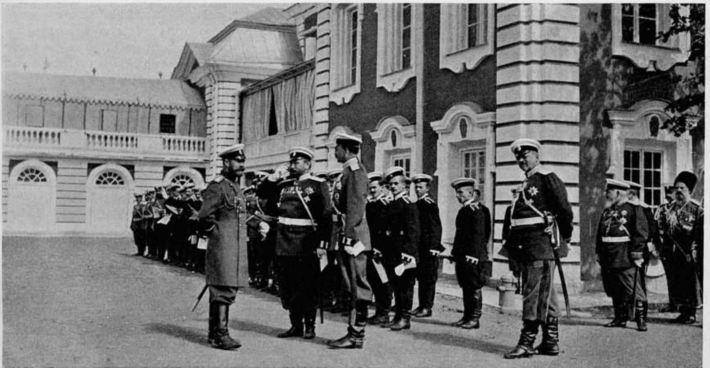
НОВЫЙ ПЕТЕРГОФЪ. ПРОИЗВОДСТВО ЮНКЕРОВЪ МИХАЙЛОВСКАГО И КОНСТАНТИНОВСКАГО АРТИЛЛЕРІЙСКИХЪ И НИКОЛАЕВСКАГО ИНЖЕНЕРНАГО УЧИЛИЩЪ ВЪ ПРИСУТСТВІИ ГОСУДАРЯ ИМПЕРАТОРА, ВЕЛИКАГО КНЯЗЯ ПЕТРА НИКОЛАЕВИЧА И ВОЕННАГО МИНИСТРА ГЕНЕРАЛЬ-ЛЕЙТЕНАНТА РЕДИГЕРА.

источникамъ знанія. Черезъ день они могли уже сообщить, что президентъ совѣтовалъ русскому уполномоченному выяснитъ своему правительству, что, отказывая въ уплатѣ контрибуціи, Россія, въ случаѣ продолженія войны, понесетъ еще большіе расходы, и взывалъ къ общеизвѣстному миролюбію Русскаго Государя. Баронъ Розень возразилъ, будто бы, президенту, что и С. Ю. Витте, и онъ самъ, охотно уступивъ по всѣмъ пунктамъ, которые не затрагивали національнаго чувства и достоинства Россіи, дошли теперь до крайняго предѣла своихъ инструкцій и здѣсь столкнулись съ совершенно противоположными взглядами и инструкціями уполномоченныхъ Японіи. Для послѣднихъ контрибуція составляетъ основное условіе мира, такъ какъ Японія прежде всего нуждается теперь въ деньгахъ. Они выяснили этотъ вопросъ, спросивъ барона Комуру, отказался ли бы онъ требовать контрибуцію, если бы признано было возможнымъ оставить Сахалинъ за