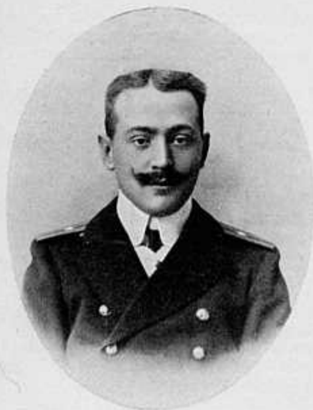
мичманъ Б. Н. ШИШКИНЪ.

Погибъ на броненосцѣ «Князь Суворовъ» 14 мая 1905 года въ Цусимскомъ бою.