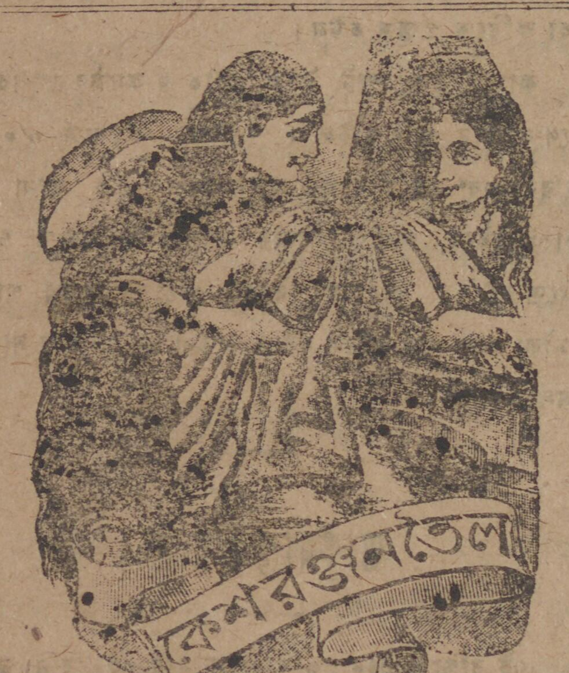
দর্পণ সাক্ষাতেই রমণীর সৌন্দর্য্য প্রতিফলিত হয়।

জাতিপুত্র সংবাদের বিজ্ঞাপন লিপ্যন্তর এক ক্রমিক পত্র হইবে। প্রতি ক্রমিক পত্রের মূল্য ১/০ এক আনা।