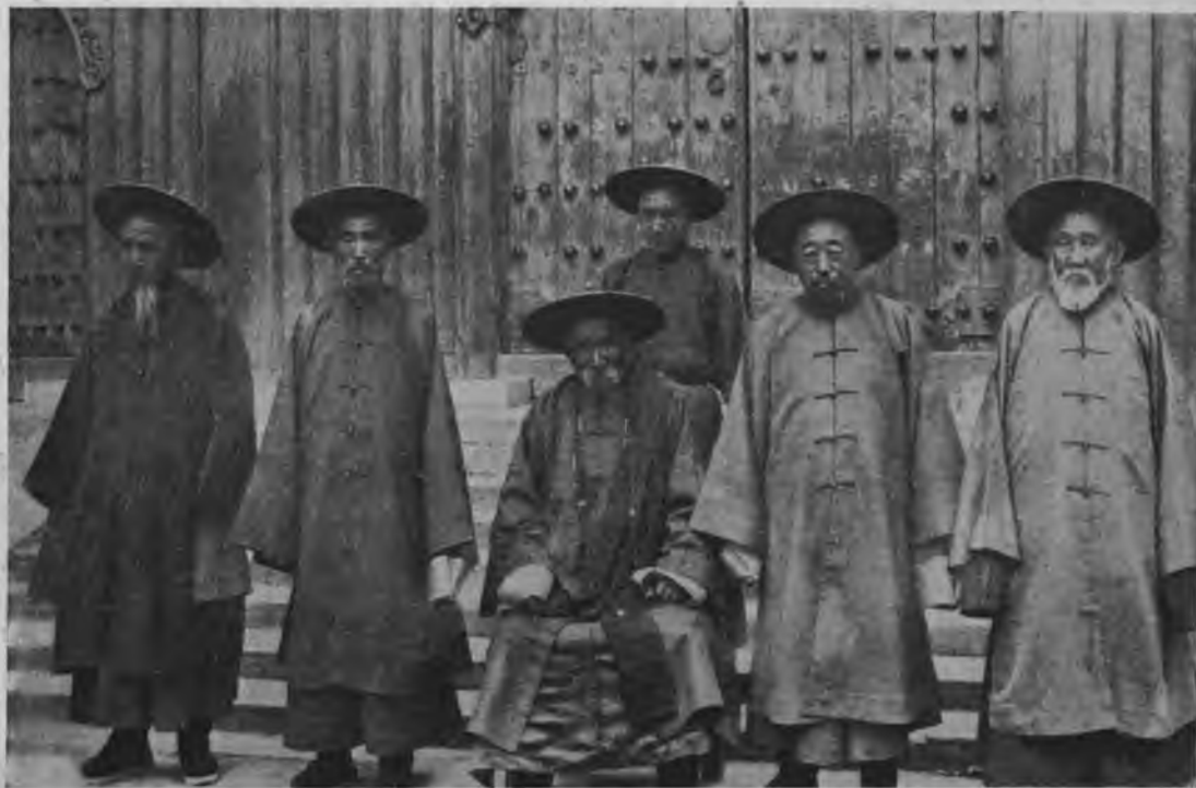
ЛАМАЙСКОЕ ДУХОВЕНСТВО ВЪ ПЕКИНЬ.