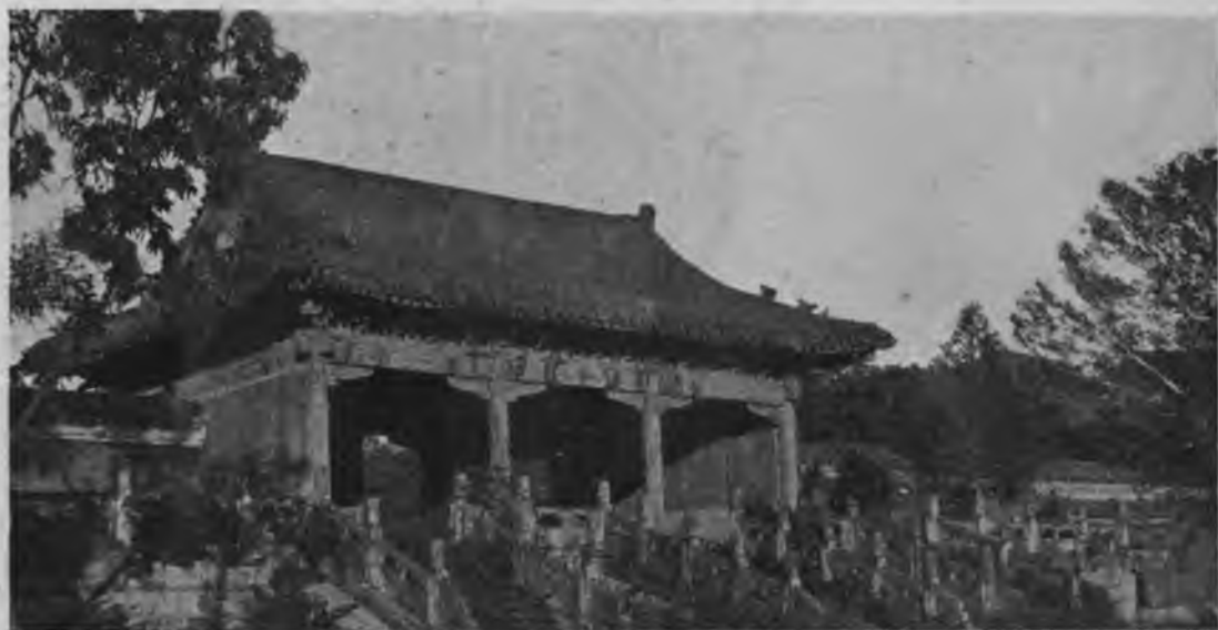
МОГИЛА ИМПЕРАТОРА ЦЗЯ-ЦЗИНА ИЗЪ ДИНАСТІИ МИНЪ, ОКОЛО ПЕКИНА.