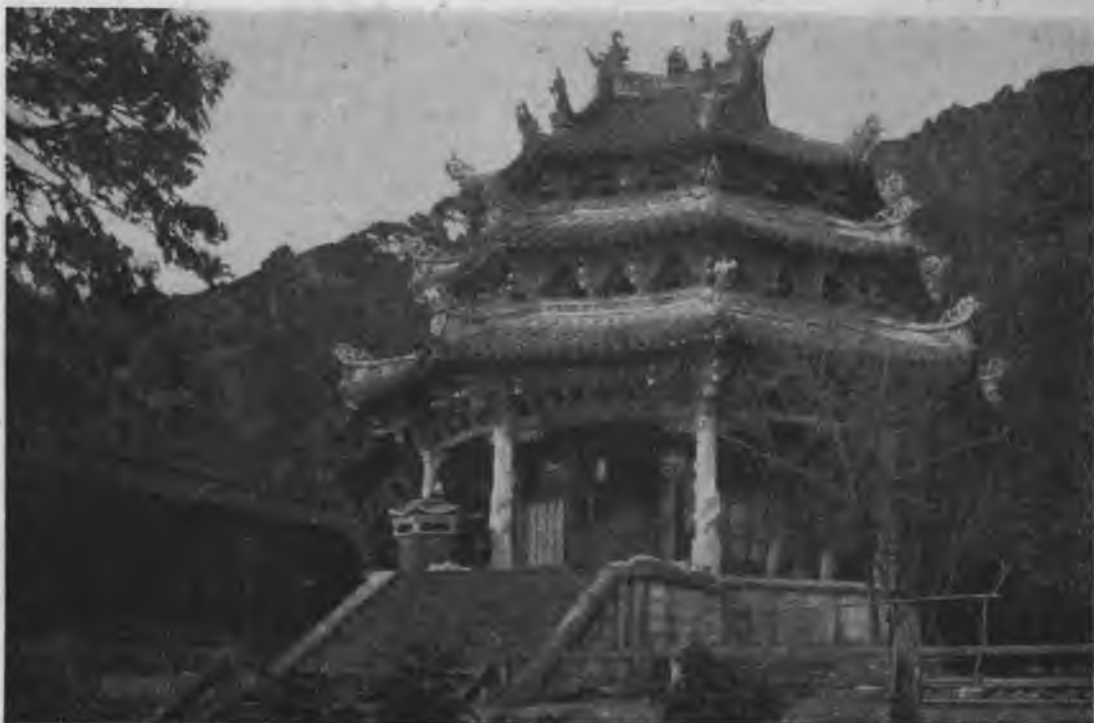
ХРАМЪ ВЪ БЛИЗИ АМОЯ, образецъ новой китайской архитектуры.