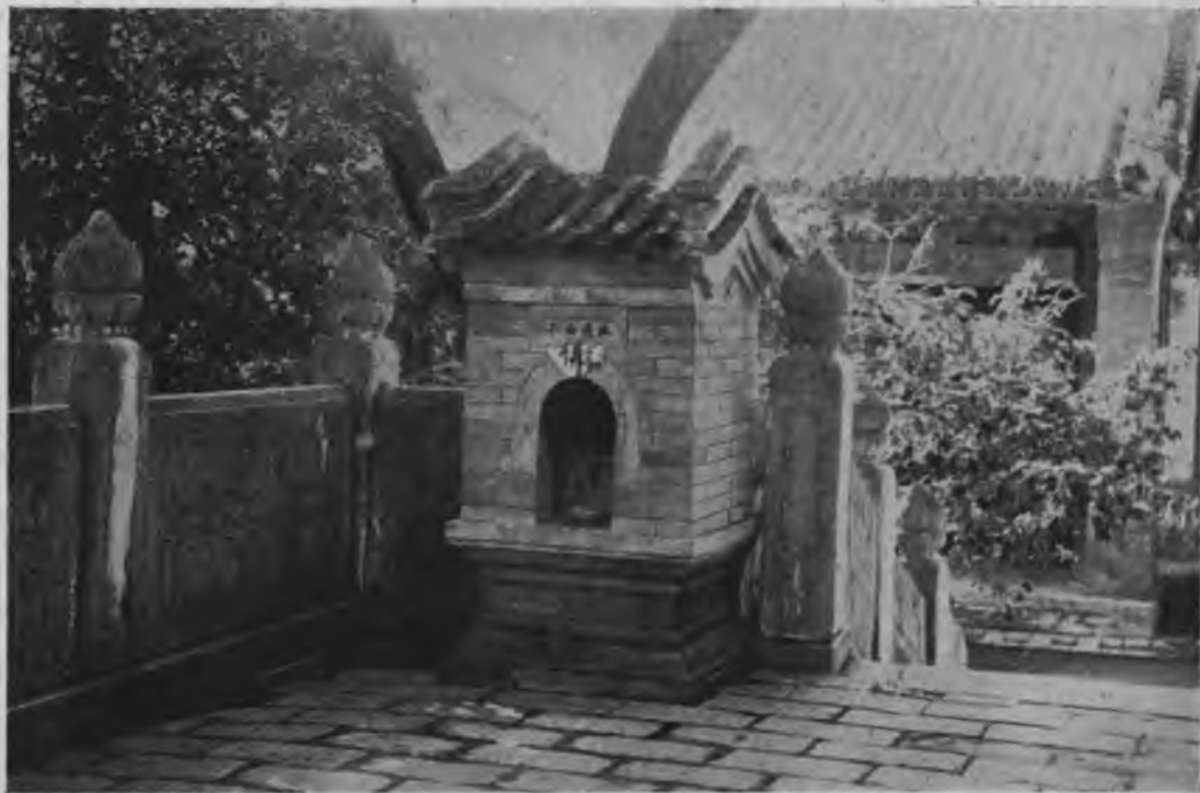
ПРИБЪЖИЩЕ ДЛЯ БЕЗПРИОТНЫХЪ ДУШЪ въ монастырь, въ окрестностяхъ Пекина.