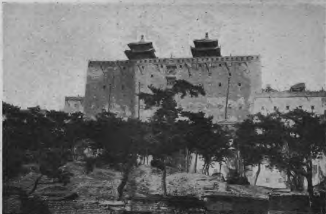
ЛАМАЙСКІЙ ХРАМЪ ВЪ ЧЕНЬ-ЦЗЫ-ФУ.