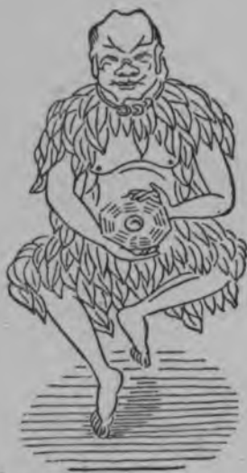
Фу-си, царь героической эпохи; въ рукахъ онъ держитъ изоб- рѣтенное имъ Па-гу-а.