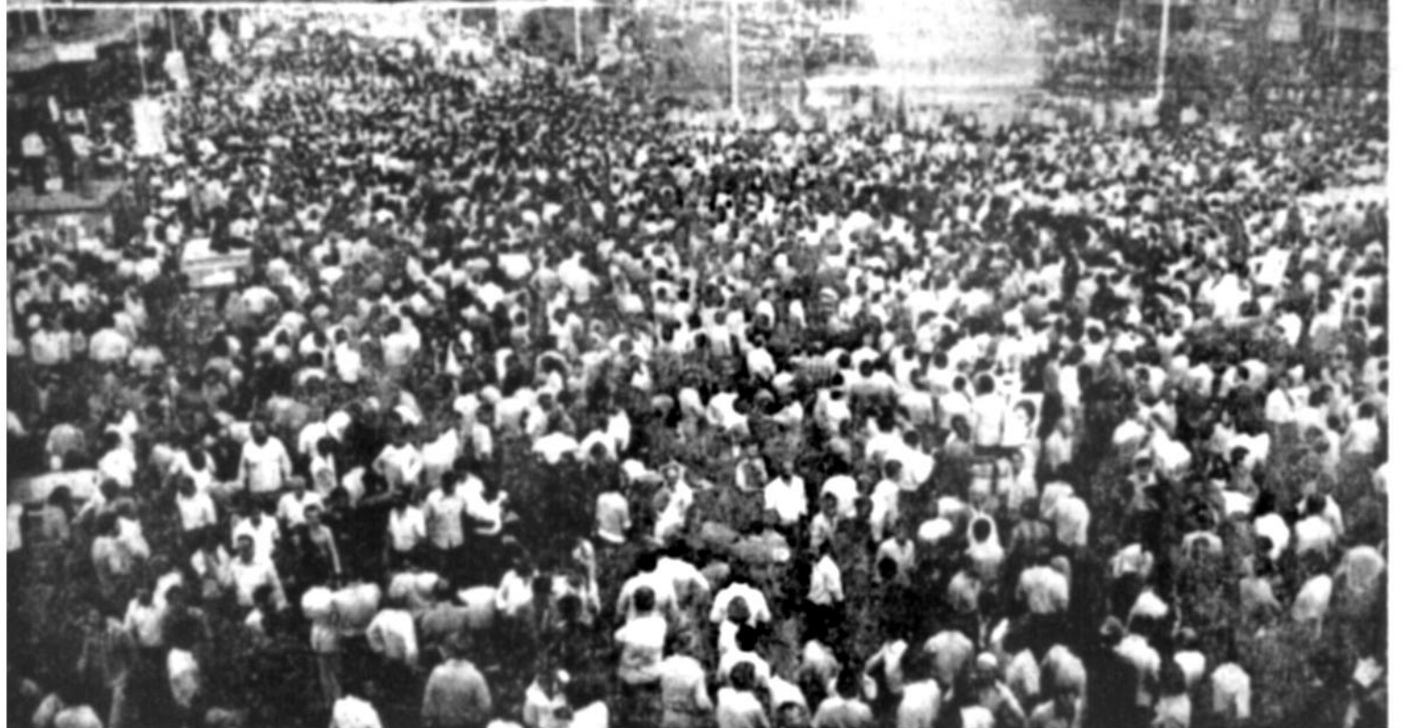
سخنرانی و ت. امروزم اعلام کرد براساس آمارهای رسمی بیش از ۱۱ میلیون نفر در شهرهای بزرگ کشور دیروز در راهپیمایی وحدت شرکت کردند. در صفحه ۲

شکست های سیاسی پی در پی و بحران انرژی عامل سقوط سیاسی کارتر است