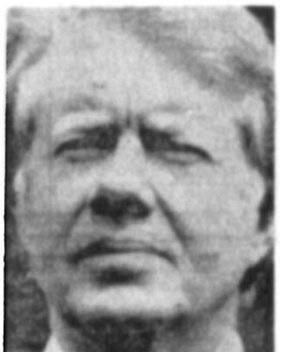
آیت الله العظمی شریعتی

طلا، در حدی که تاریخ بیاد ندارد گران شد در صفحه ۲