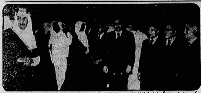
عکس هیئت‌های نمایندگی ایران (شاهنشاهی) و عربستان را در کنفرانس اسلامی لاهور نشان میدهد رژیم‌های سلطنتی این دو کشور در واقع از سرمداران و بنیان‌گذاران انقلاب اسلامی بودند.

به علاقه خاص مردم این کشورها به اسلام، زمینه روانی این اتحاد دافقین و فرهنگ‌گاران را که در طرح کیسینجر مورد نظر است مهیا میساخت. بنابراین موفقیته دکترین کیسینجر رسماً در