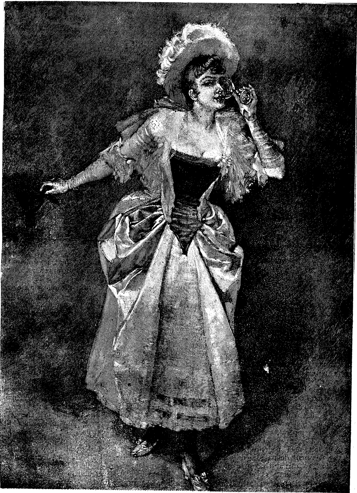
UN PAHAR DE ŞAMPANIE.