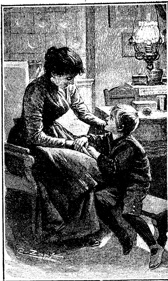
Frate și soră.