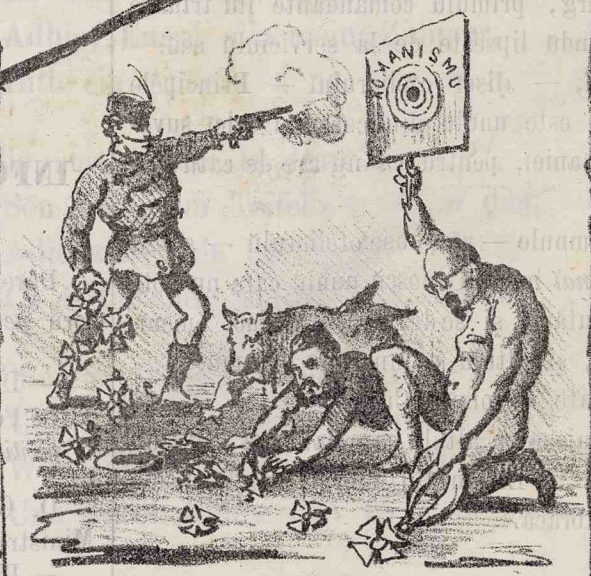
Triumfulu Ministriloru in po-litica esterna.