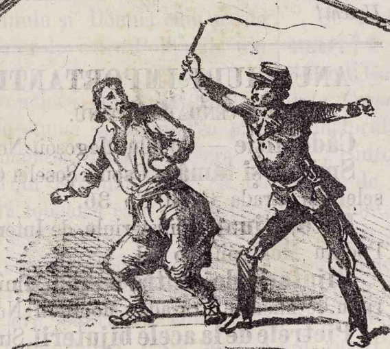
Contributtunea spontanea si Vo-luntarie pentru Coronitu in Vlasca.