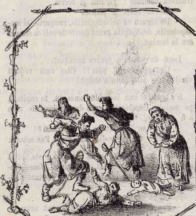
Pe onorea mea, nu s'a facut un micu la Cuca-Macai. A. Zisu.