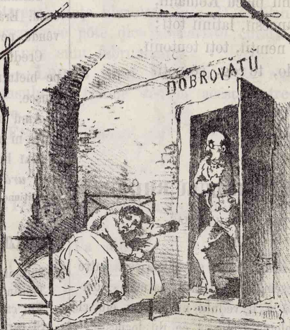
A! Muriti? Aha! ha! ha! Amu scapatu de unulu.