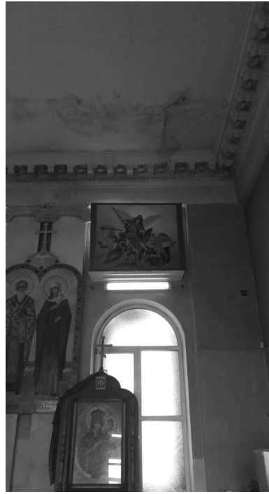
Так званий ремонт у Кафедральному соборі святих рівноапостольних Володимира і Ольги в Сімферополі

них князів Володимира і Ольги та Управління Кримської єпархії Української православної церкви (Православної церкви України) у м. Сімферополі, у створенні перешкод для доступу духовенства і вірних до храму та єпархіального управління. Православна церква України вкотре вимагає від Російської Федерації припинити свідоме порушення в окупованій АР Крим та м. Севастополь одного з основоположних прав людини – права на свободу совісті та віросповідання.