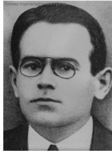
Антон Слуцький – голова Ради народних комісарів Республіки Тавриди

Ці «чвари» не залишалися лише на рівні побутових сварок. У травні 1918 р. конфлікт вийшов