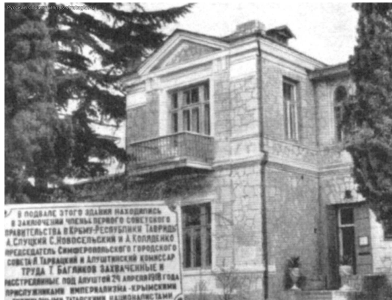
Будівля Алуштинської бібліотеки. В її підвалі утримувались перед розстрілом члени Раднаркому ТРСР