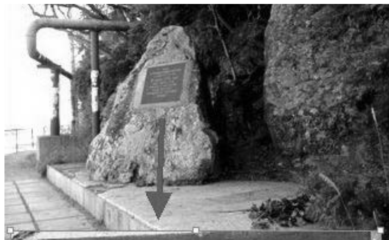
Пам'ятний знак на місці взяття у полон членів Раднаркому ТРСР

Севастополем 3 . Так само стверджував і Ж. Міллер: «Слабкістю парторганізації першої радянської влади в Криму були чвари за першість, за керівну роль Сімферопольської і Севастопольської організацій. Севастопольська організація дуже неохоче сприй-