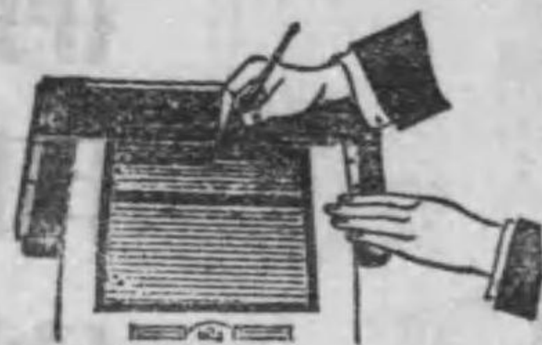
受手臺兼用規定に なり原稿を認む

國際式謄寫機 實用新案特許 第五一〇〇番 第五一三八九 第五一八二四 第五四一四〇 第五五二九七 第五五二九七 第五五二九七 第五五二九七