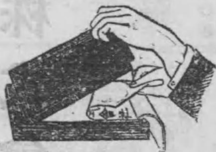
右手を以て印刷し 左手を紙に刷る

◎本機は外務省の選擇を得て國際聯盟會議及勞働會議の御用品 ◎本機は構造特殊の考案に成りたるが故赤青紫等隨意の色に印刷せんと するに際し「ルーラー」「インキ」版を洗滌の要なし ◎本機の特長鐵筆・毛筆・タイプライター・各種に完全併用さる ●印刷鮮麗●取扱簡易●印刷敏捷●其の特色なり