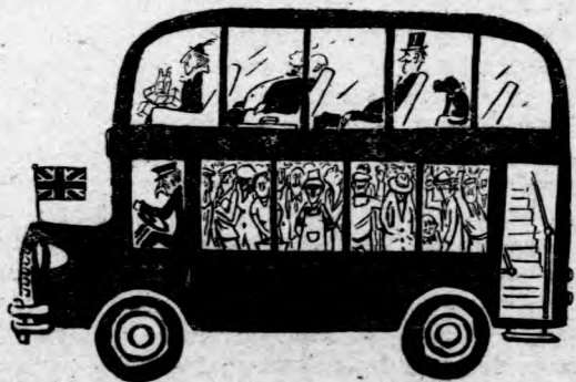
英 籍 博 圖

列寧曾經指出：“英國資產階級欺騙、腐蝕和收買工人的手腕是舉世無雙的。”在第二次世界大戰結束以後，英國的頭等國民又創造了一條新的改良主義措施來腐蝕和收買英國的二等國民。工黨執政的五年就是這種腐蝕和收買的五年，替頭等國民作了很好的很有效的服務。其結果就是改良主義思想仍然在目前英國的工人運動中占統治地位。但是，在另一方面，英國的殖民體系瓦解了，它雖然竭力掙扎，繼續剝削其前殖民地國家，企圖繼續刮一些錢來繼續收買工人貴族，可是，它的困難是越來越大了，它“欺騙、腐蝕和收買”二等國民的迴旋余地是愈來愈小了。根據最近種種情況來看，英國的二等國民的政治覺悟正在開始有些提高，工人貴族的影響和改良主義的幻想開始有了一些削弱，他們的革命傳統的一面開始有了一些發揚，這是值得我們注意的。