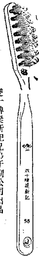
雙十牌梁新記兄弟牙刷公司出品

近世紀最新發明的牙刷。同時用 梁新記 總經理的（奇士美牙膏）擦牙。齧鹹牙齒。立即雪白。二美俱備。相得益彰。