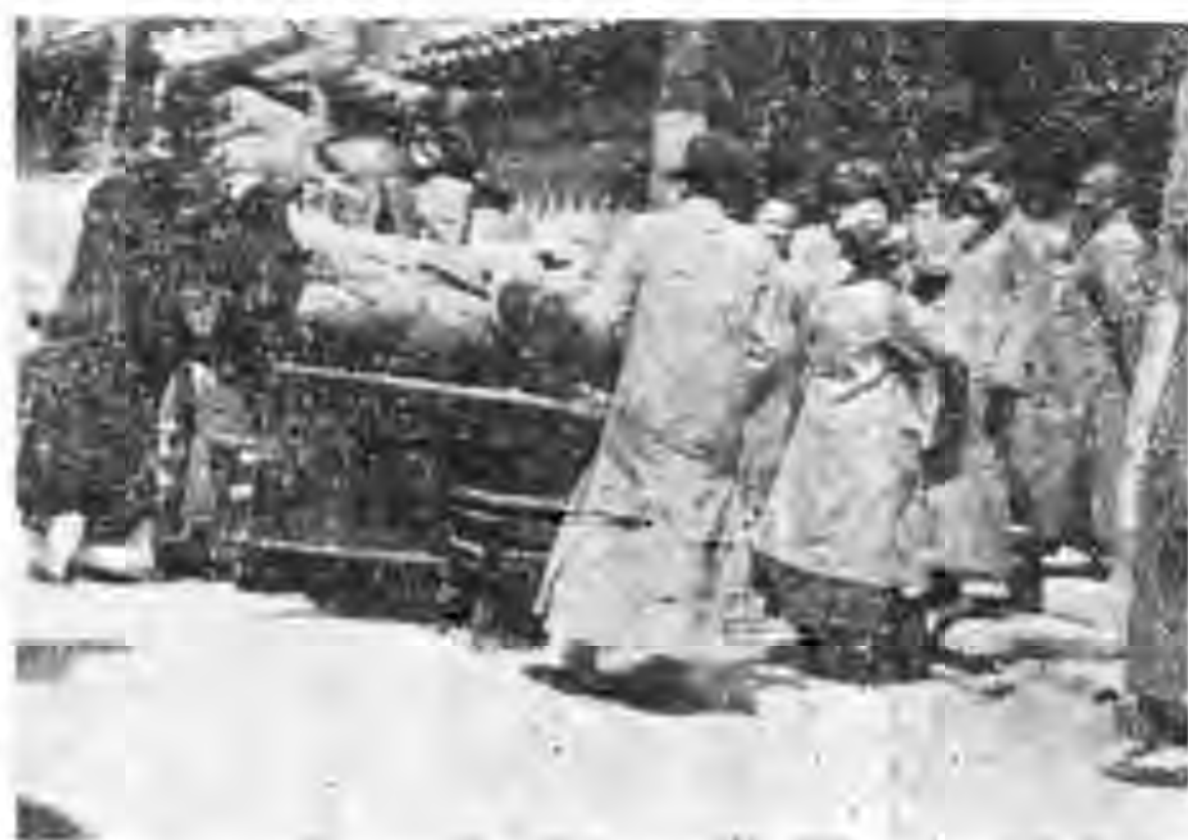
農賑人員出發察省工作

密雲東智東村曾開了一次社員會。議決了四項要作的事情。(一)該社社員借到賑款後。已可暫時維持農耕。不再加添社員。或加借賑款。以致延長改辦合作的期限。(二)該村附近的道路。凡被雨水冲壞的。即由社員們隨時修理。以利行人。(三)村中貧戶的房屋。有應修理的地方。即由社員們白盡義務。前去幫忙。(四)協助該村原有之造林委員會。重修原訂規章。呈請縣府立案。并聞該社正積極籌備改辦合作云。