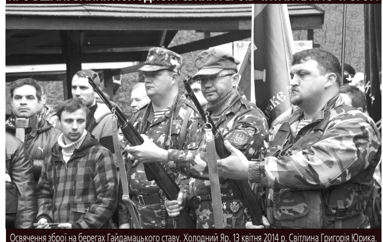
Освячення зброї на берегах Гайдамацького ставу. Холодний Яр, 13 квітня 2014 р.

Нелюдське ставлення росіян до нас освячує нашу до них ненависть.