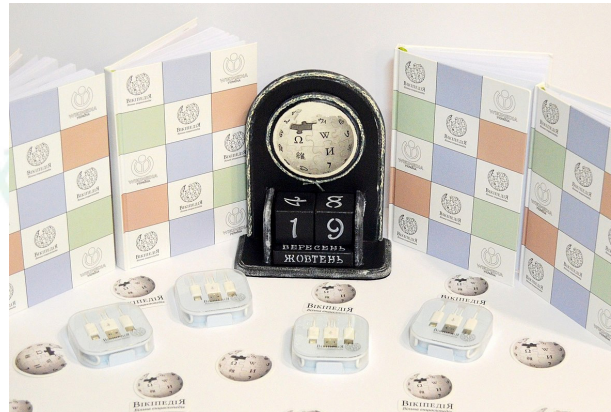
Сувеніри конкурсу «Вікіпедія для школи»

Більше про проєкт за посиланням — shkola.wikimedia.org.ua