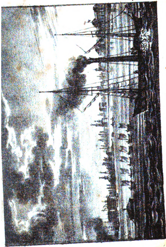
Уаомъ сѣра с Франкоуца, и Сиродана.