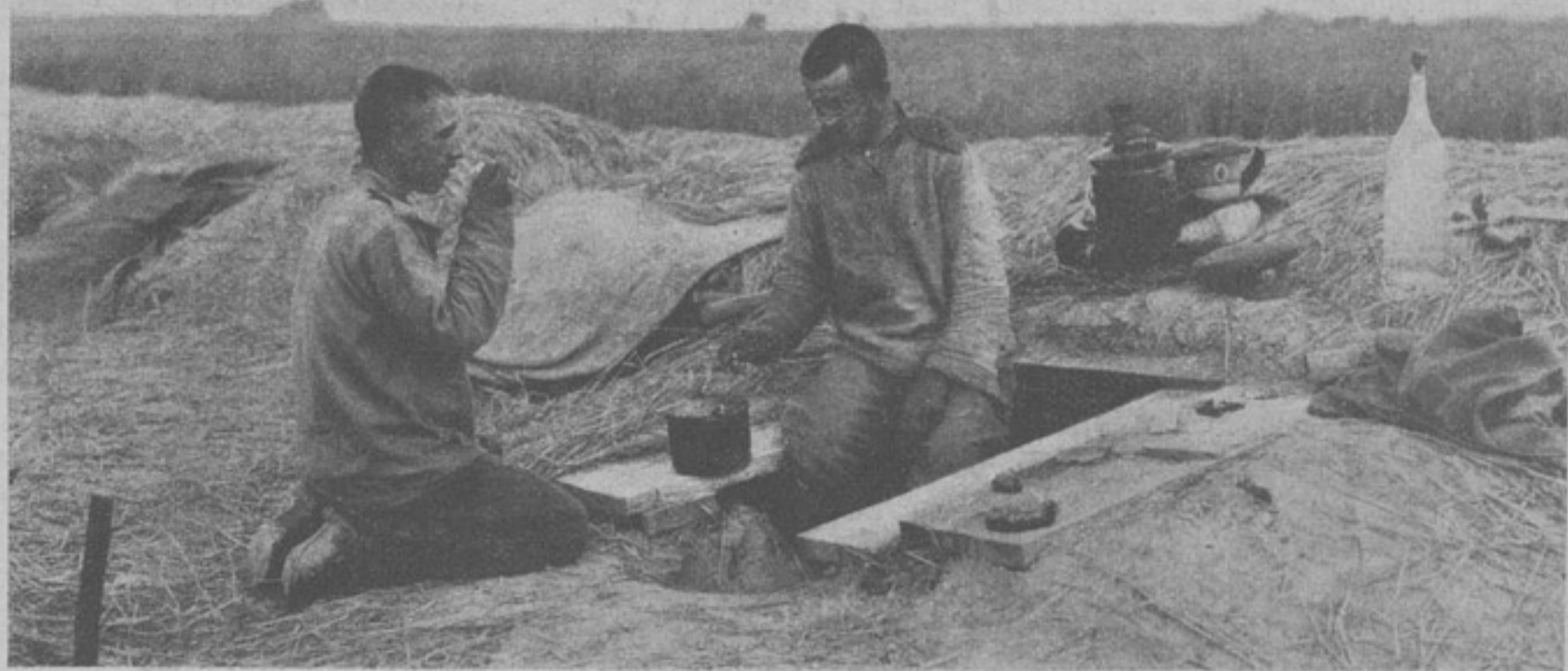
За обѣдомъ. (Фотогр. шт.-кап. Корсакова).

Видя, что дѣло начинаетъ принимать рѣшительный оборотъ, я, подбадривая солдатъ и отдавая приказанія, обнаружилъ себя непріятели и меня вдругъ ударило что-то въ грудь: пуля пробила легкія насквозь, но особенной боли я не чувствовалъ и разгоряченный, продолжалъ управлять боемъ.