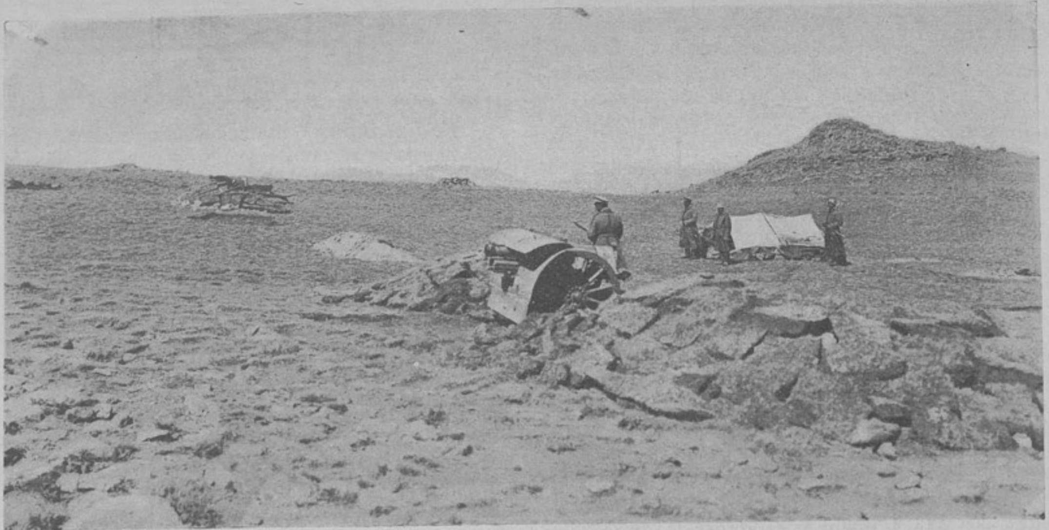
Батарея на позиціи.

Противникъ частью бѣжалъ, частью былъ переколотъ. Въ плѣнъ взято 2 офицера и 177 нижнихъ чиновъ, захвачены также и 1 пулеметь, 190 винтовокъ, много патроновъ и снаряженія.