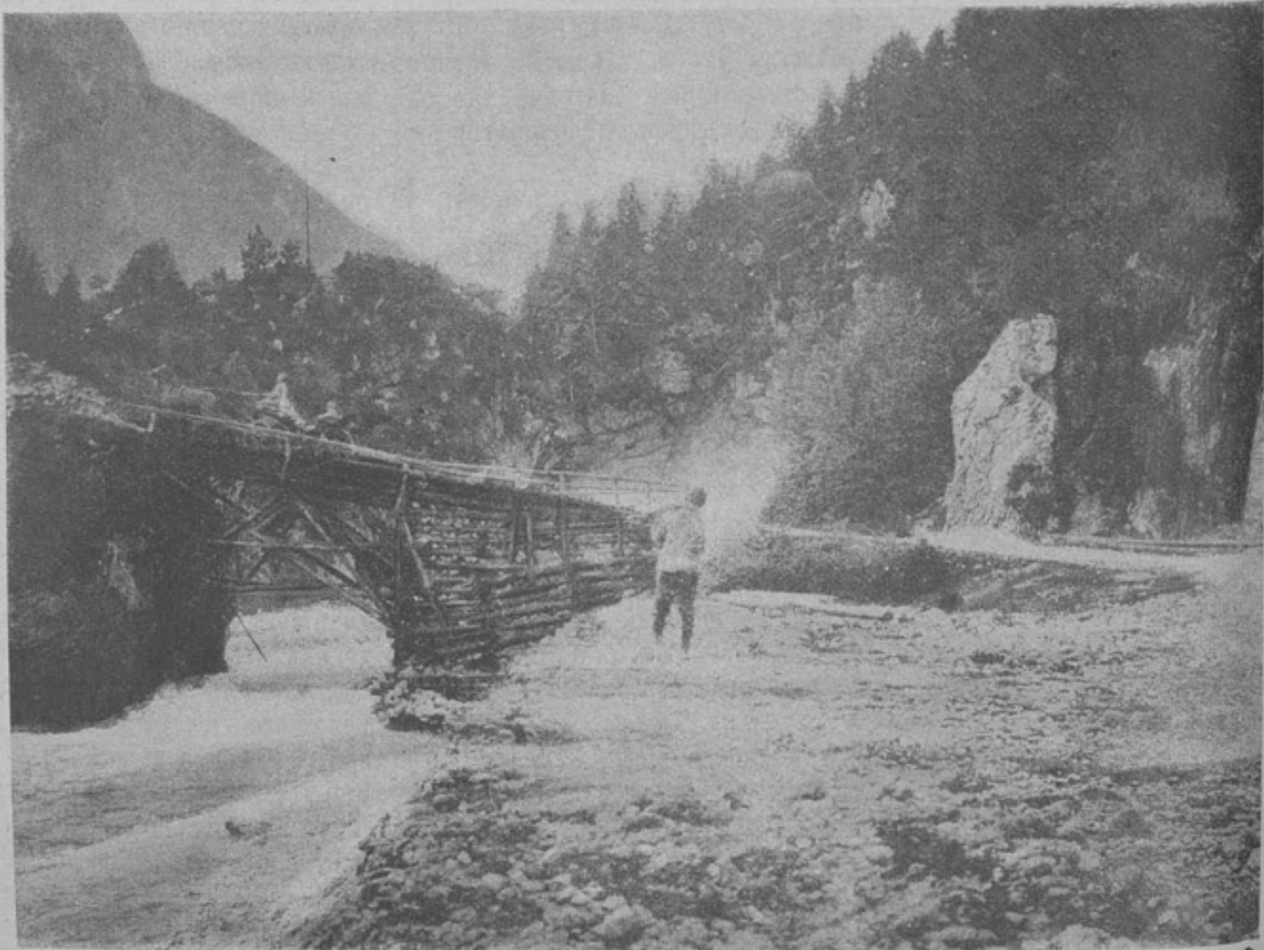
Временный мостъ черезъ Изонцо.

Вчера была цѣль впереди, цѣль трудно достижимая, но въ высокой степени интересная, подымавшая человека нравственно, возбуждавшая его инициативу. Сегодня осужденіе стоять на мѣстѣ, въ самой тяжелой обстановкѣ, въ виду превосходнаго непріятеля впереди, а позади — мутныя, холодныя воды Вислы. И поддержки никакой, ни откуда. Настроеніе поневолѣ сдѣлалось не радостнымъ. Къ тому же всю ночь