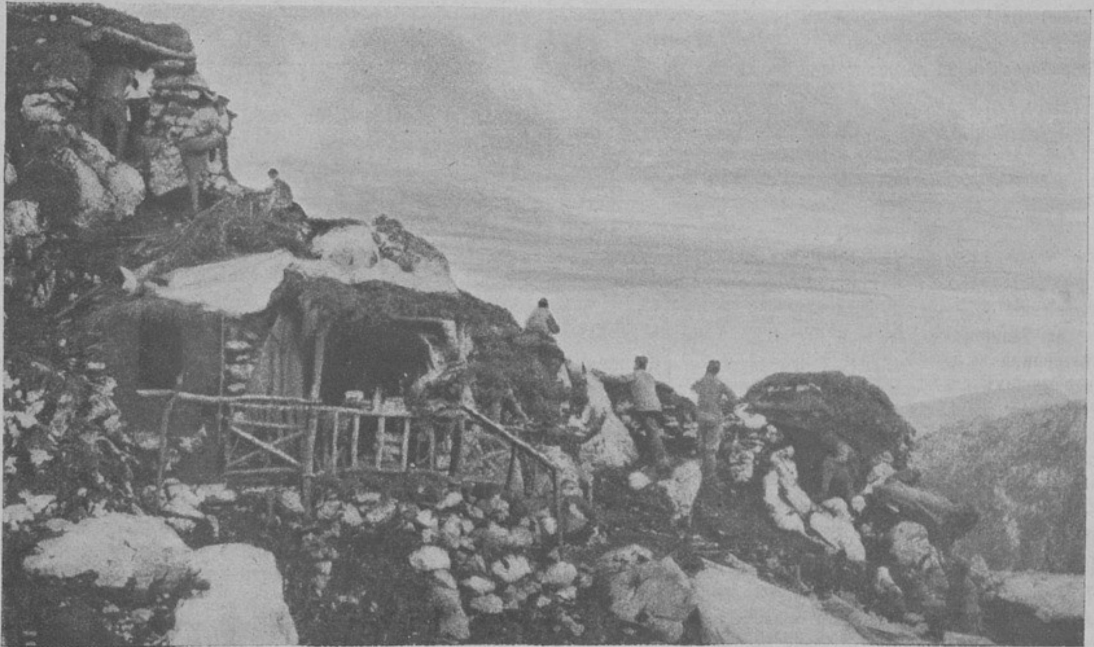
Участокъ одной изъ позицій австрийцевъ на итальянскомъ фронтѣ. („Welt-Spiegel“).

Кричать эти господа въ обществѣ, клубахъ, салонахъ.