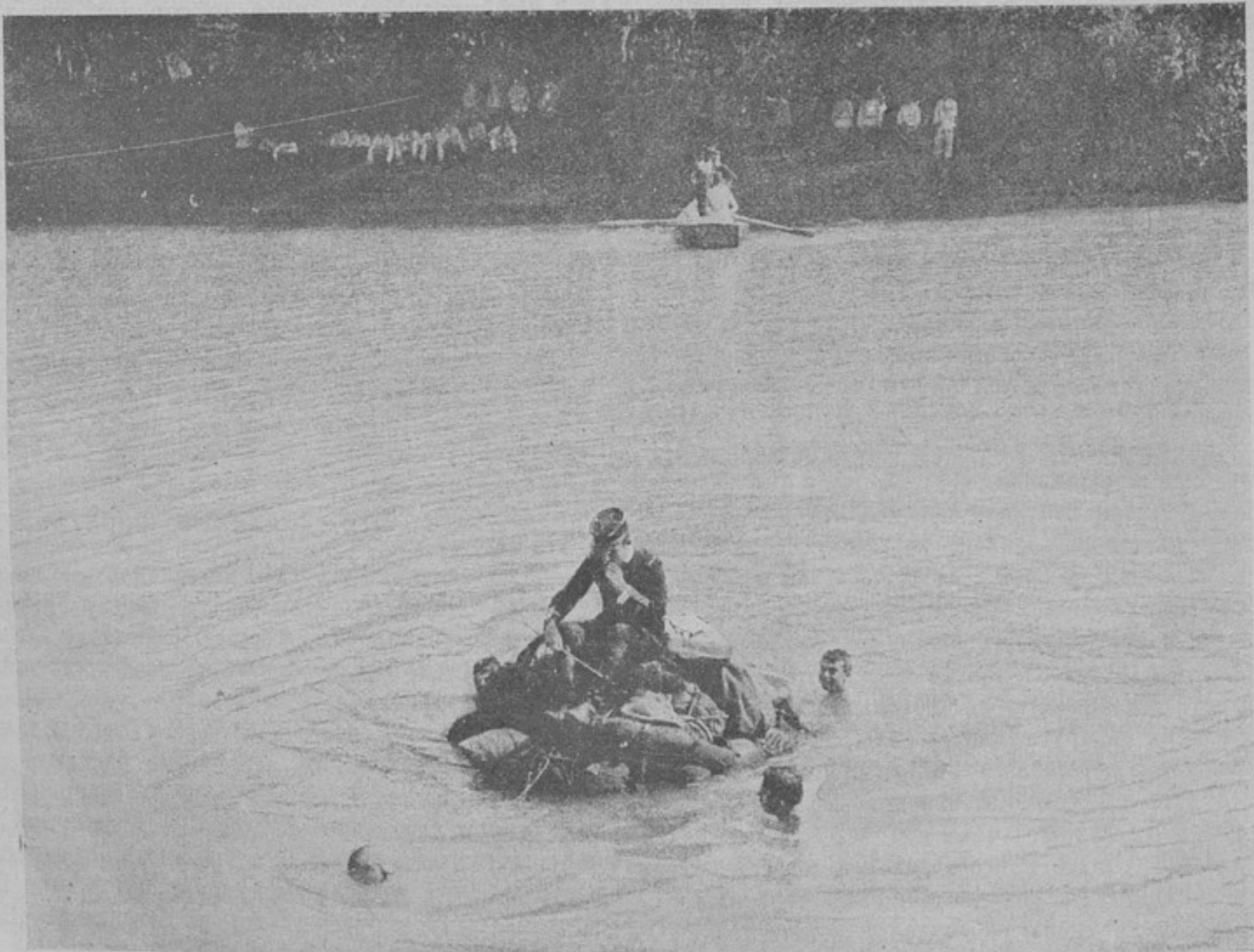
Съ французскаго фронта. Переправа на плоту изъ подручнаго матеріала.

13-го ноября. Въ районѣ западнѣе м. Олыка (между Ровно и Луцкомъ) противникъ пытался продвинуться, но подъ угрозой охвата отошелъ въ прежнее положеніе. Такъ же неудачна была его попытка продвинуться къ д. Яновеа сѣверо-восточнѣе Бучача.