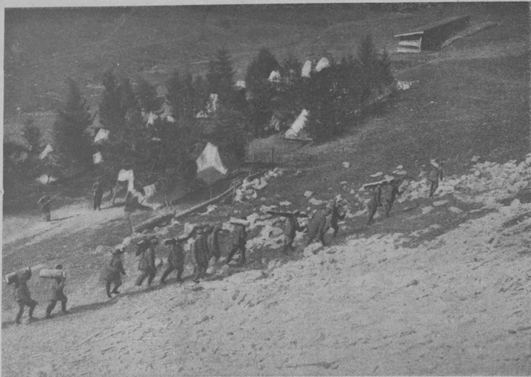
Бивакъ итальянцевъ въ горахъ. („L'Illustrationi Italiana“).

подъ нашими штыками. Охотники потеряли при этомъ только 7 человекъ ранеными и 1 контуженного, причемъ одинъ раненый остался въ строю.