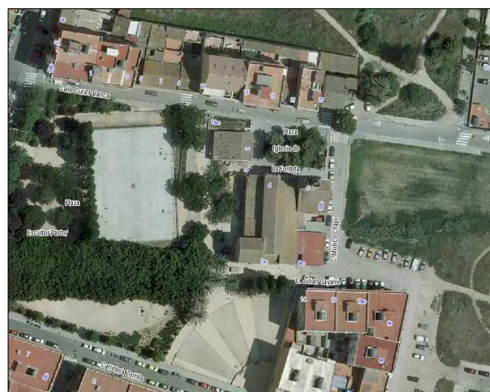
Fotografía Aérea 2008