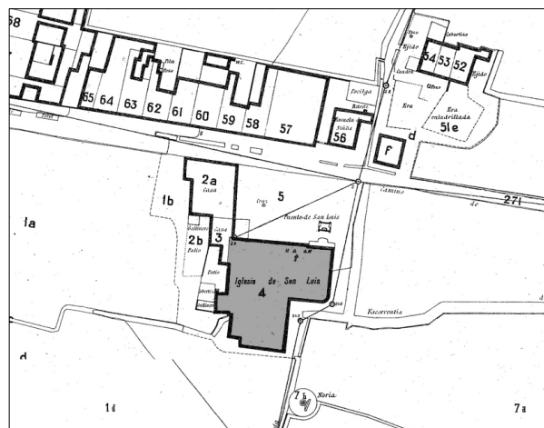
Cartográfico Municipal 1929-1945