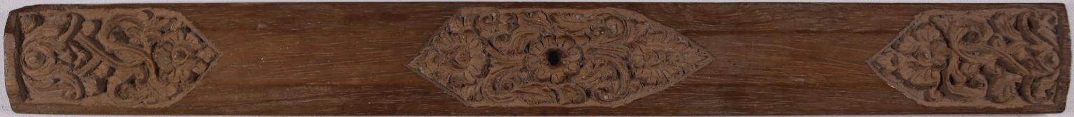
ប្រាសាទសិរីគុរុសិរី Babad Pasek Gelgel ប្រាសាទសិរីគុរុសិរី Druwen Griya Toko Lod Pasar, Sanur, Denpasar.