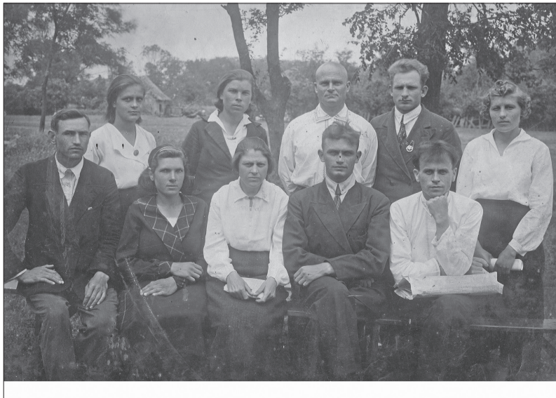
Педагогічний колектив Пригарівської семирічної школи 1938 рік.