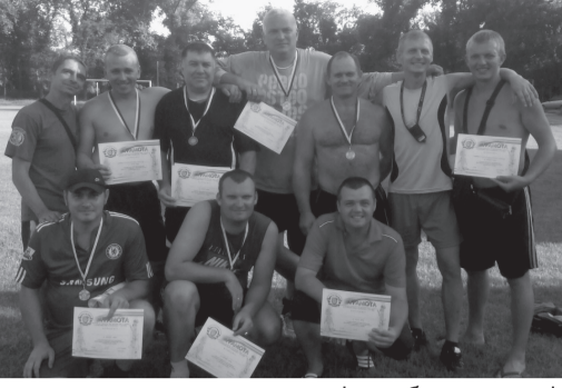
перемогли кременчужан і здобули золоті нагороди.

МІНІ-ФУТБОЛ Розпочався кубок Козельщинського району з футболу, присвячений 25-й річниці Незалежності України. 14 серпня відбулися матчі: «Дружба» Солониця — «Ветеран» Козельщина 8:1 Козельщина — Н.Галещина 2:8 Говтва — «Колос» Пашківка 1:3 «Спарта» Лутовинівка — пропуск. Матчі-відповіді — 20 серпня.