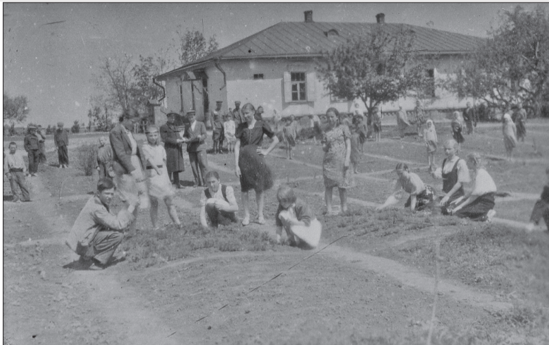
Робота юннатів на дослідних ділянках Пригарівської школи, удостоєна участі у ВДНГ у Москві в 1941 році. Фото 1939 року.