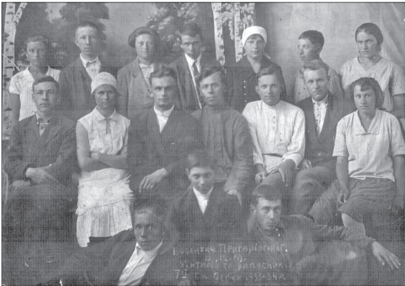
Учителі й учні першого випуску Пригарівської школи, 1934 рік.