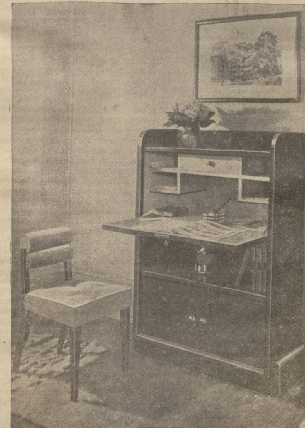
Son moda güz el bir yazhane

Halbuki kadim Yunanların saadeti. 1934 te yaşanan bir adamın saadetinden büsbütün başkadır. Venus de Me-