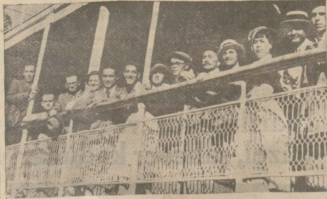
Yunan Dağcılık kulübüne mensup yirmi sporcu dün Romanya vapuruna şehrimize gelmişlerdir. Yunanlı sporcular buradan Bursaya gidecekler ve Uludağ'da Spor yapacaklardır.

— Bugün para artık bir mübadele vasıtası olmaktan çıkmıştır. Harp sonrası iktisadi icabatından olmak üzere, memleketler daha ziyade trampa sistemini an-