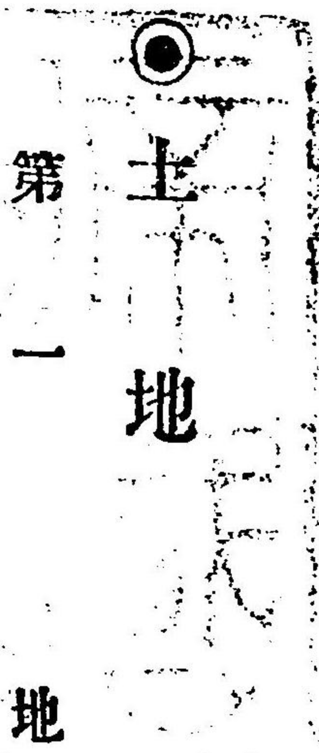
第一 地 勢

本郡ハ石見國ノ稍ヤ東端ニ位シ東ハ安濃郡西ハ那賀郡ニ隣リ南ハ邑智郡ニ接シ北ハ日本海ニ瀕セリ全郡ヲ分チテ二町十八ヶ村トシ周圍大凡ソ二十六里十六町ニシテ其沿海數村ヲ除クノ外ハ山岳重疊シ平坦ノ地少ク到ル處土壤礫礫ニシテ米麥ヲ作ルニ適セス