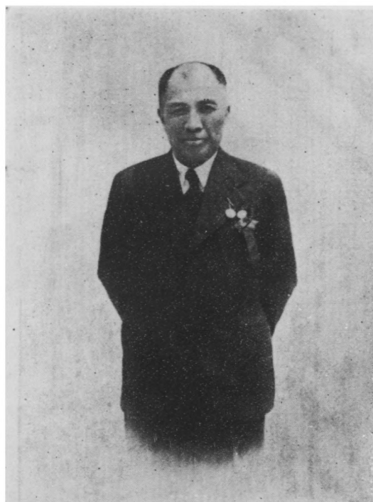
趙 教 育 部 長