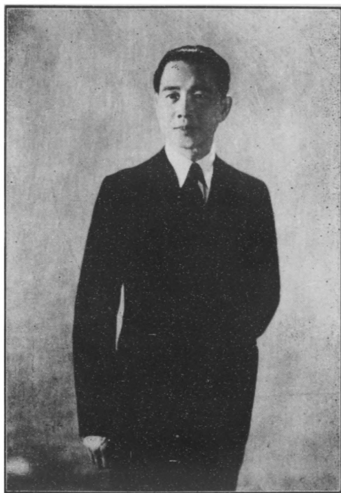
汪 代 主 席