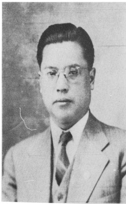
長 六 王