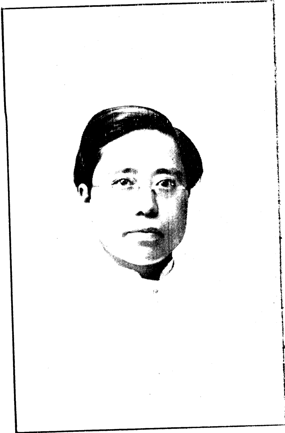
( 雙 熱 之 影 )