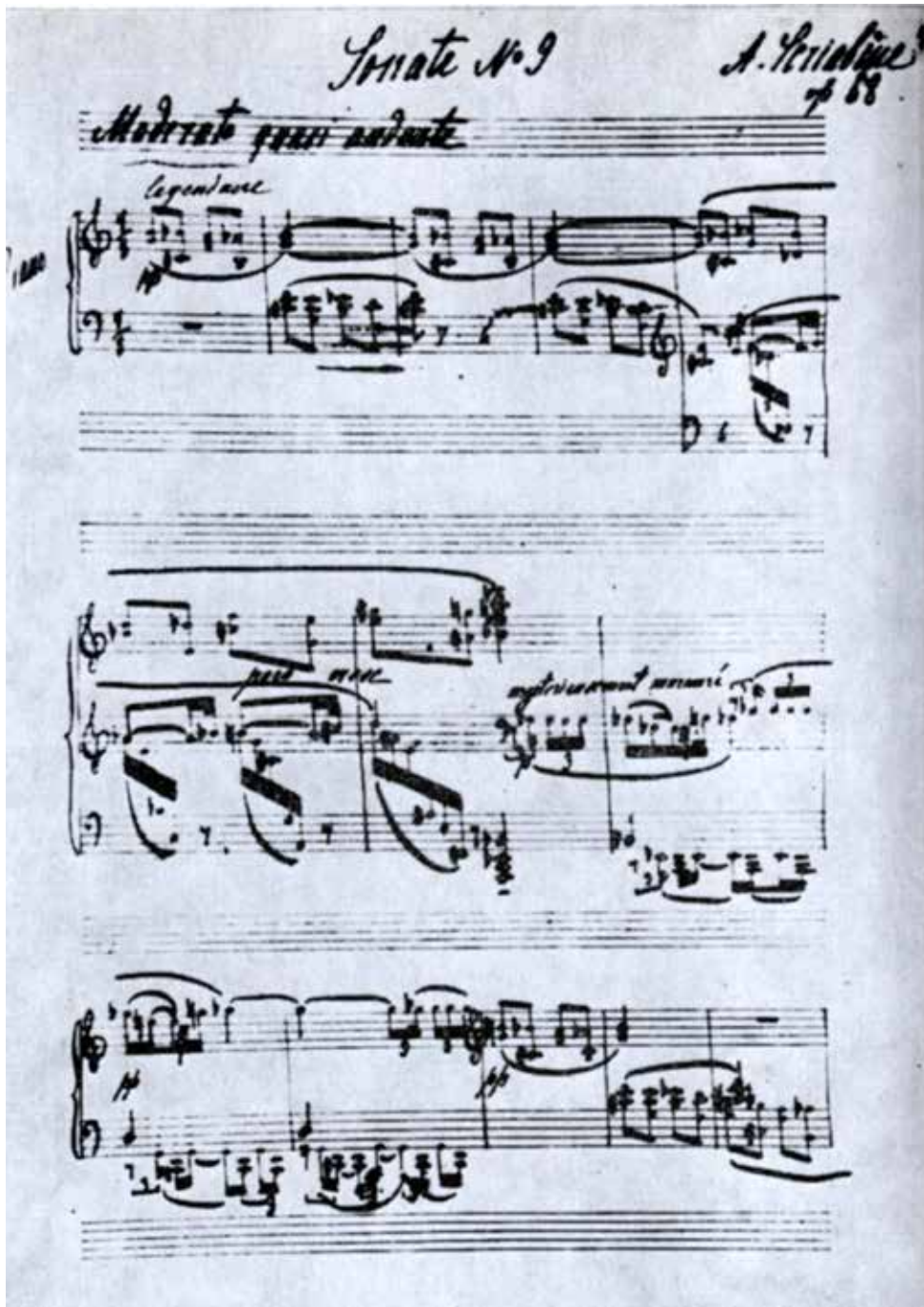
Eerste pagina uit het manuscript van de Negende Sonate.

naar sensualiteit en extase met microtonen en elektronica zijn gaan experimenteren.