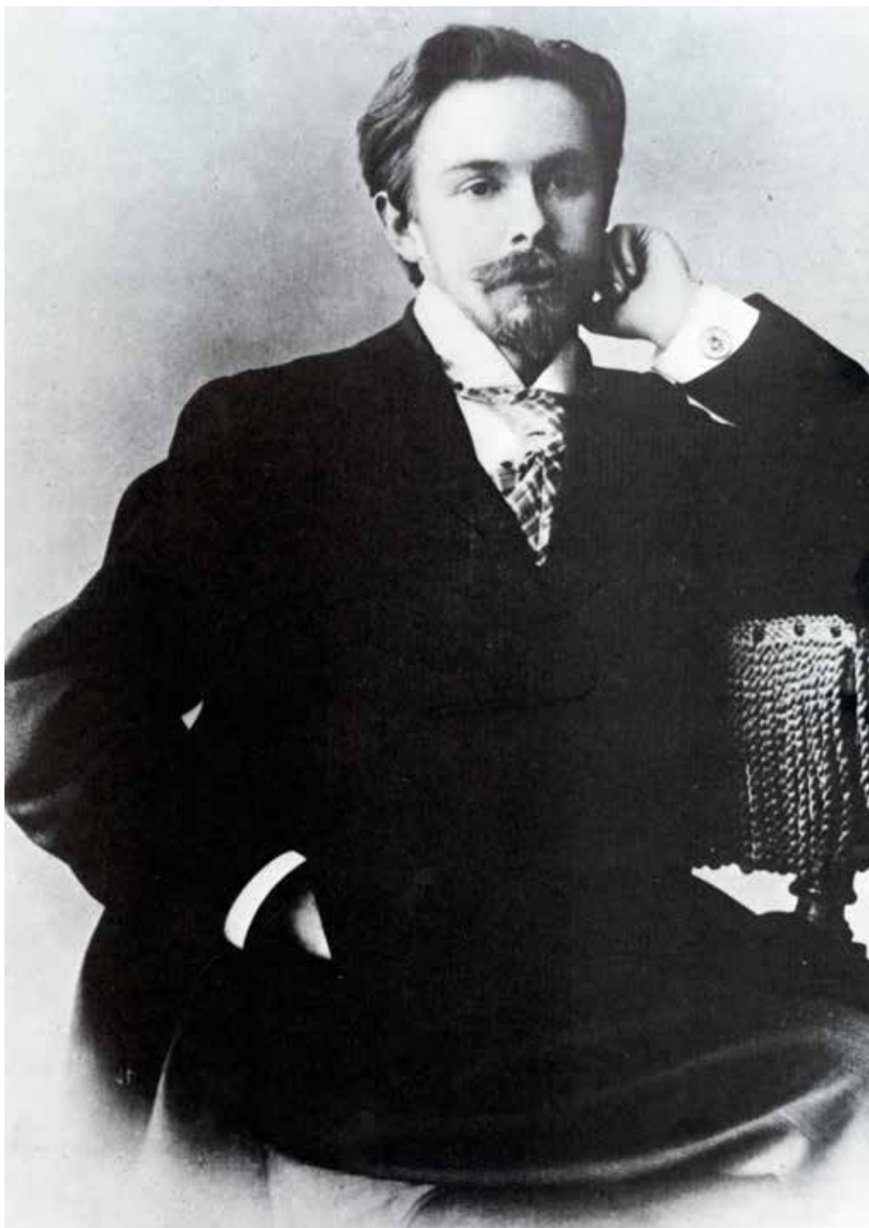
Alexander Scriabin