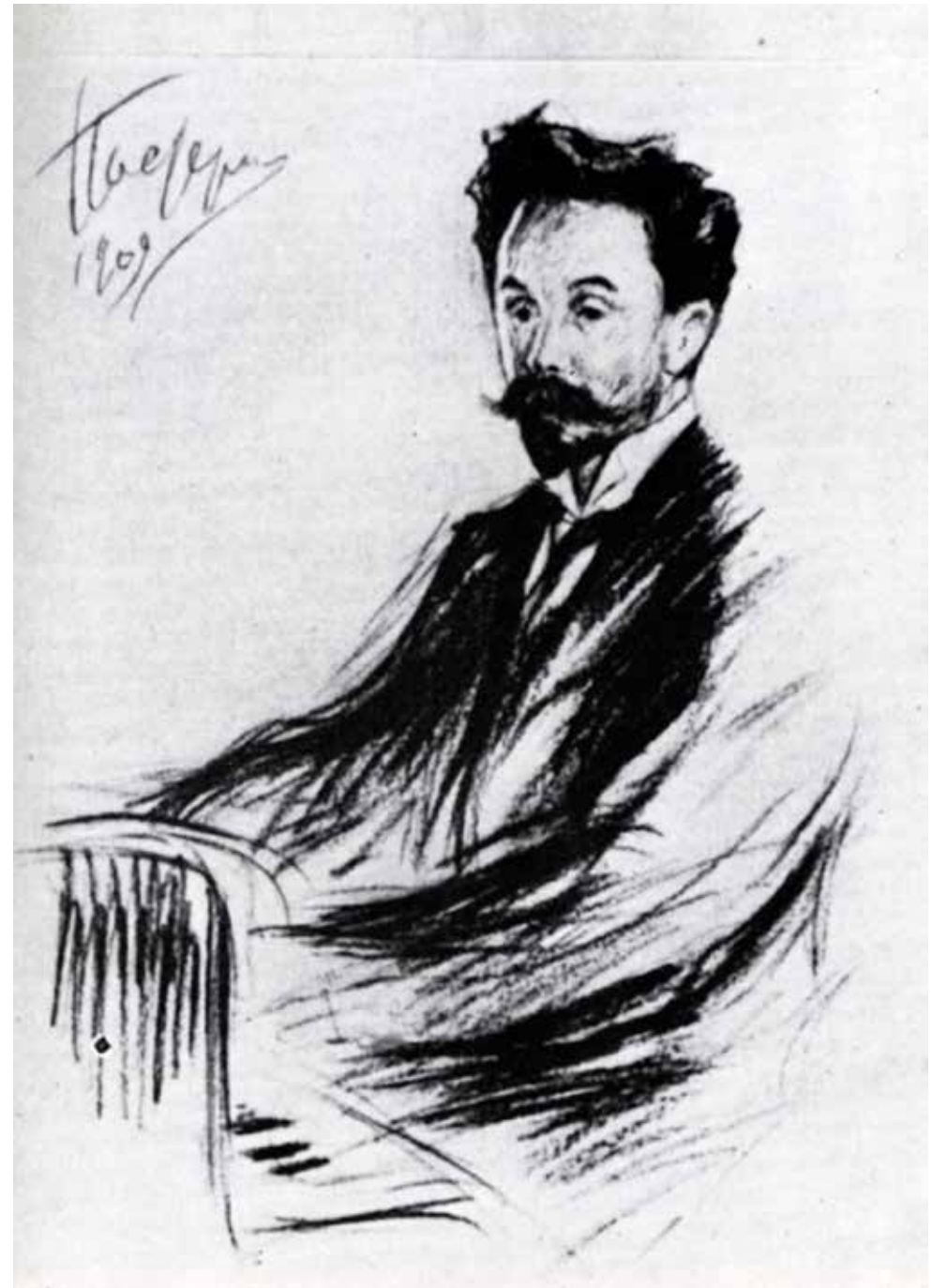
Alexander Skrjabin, tekening Leonid Pasternak