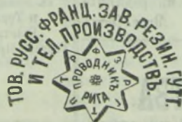
Фабричное клеймо звѣзда съ надписью фирмы Т-ва (выпуклое).