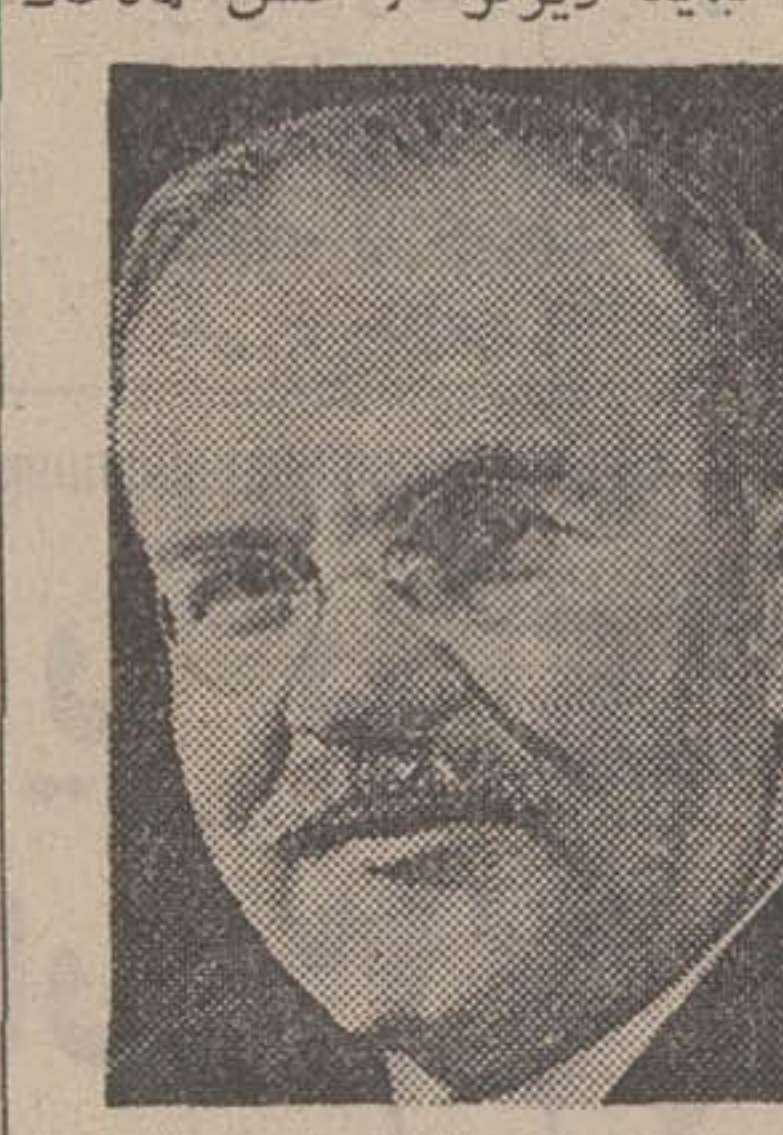
ویاچسلاو مولوتوف وزیر امور خارجه شوروی

اعلامیه پذیرش متفقین به واگذارن گفت‌وگو های نفتی به پس از جنگ، پذیرید تا در آینده راه برای گفت و گوهای جدید، باز باشد. درباره خروج نیروی متفقین از ایران، نیازی به تغییر پیمان نیست زیرا پیمان‌نویس مقرر میدارد که ارتش متفقین نباید در تری از شش ماهه خاک