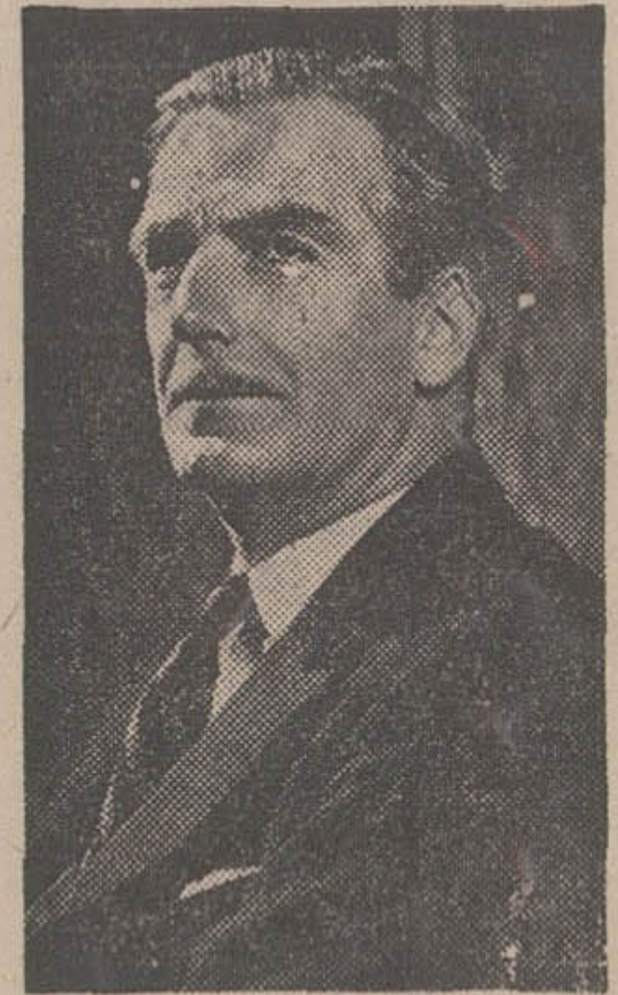
آنتونی ایدن وزیر امور خارجه انگلستان

ماجراهای جنگ جهانی امتیاز نفت شمال، مردم چنگدیده ایران را بیش از پیش می‌پوشد همین‌طور بدگویی و تخریبی، ناقوسها را برای دولت محمد ساعد به صدا درمی‌آورد و در گرامر کم این جبهه، مجلس شورای ملی به مرتضی‌قلی بیات رای اعتماد میدهد و چنان که گفتم پدوران صادرات او برای آن که مشکل نفت - به زیر آورنده دولتها سازمان برادشته‌شود، با تمام تلاشهای دامنه‌دار نمایندگان عضو فراکسیون حزب توده و مخالفت های خطرناک این گروه، قانسون تحریم نفت و گاز، پیرامون نفت از مجلس میگذرد.