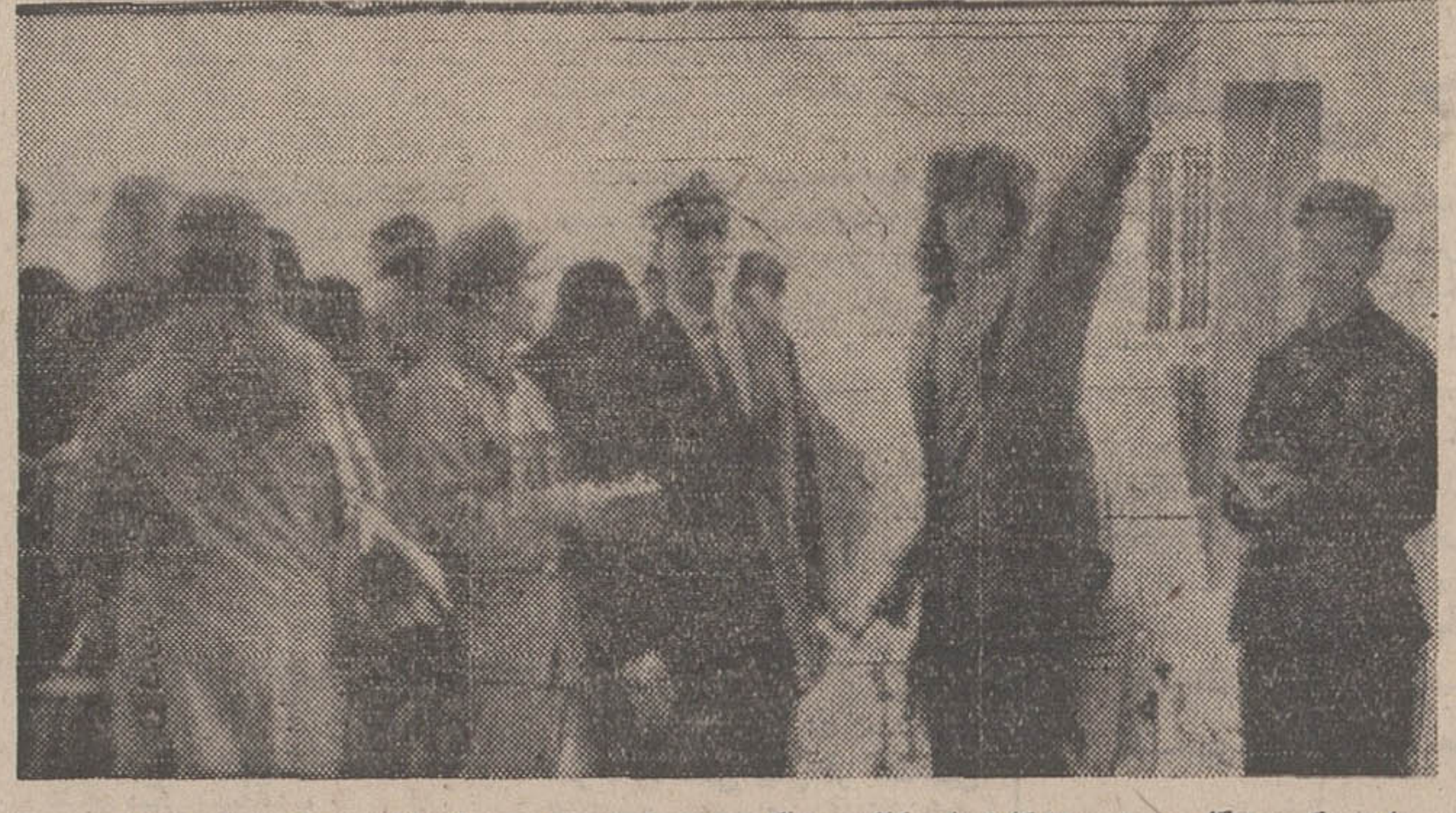
این عکس هنگام ورود ورزشکاران امریکائی بخاک چین کمونیست در یک نقطه مرزی شان فیده شد. در عکس یکی از ورزشکاران امریکائی بنام گلنگودان دیده میشود که در میان مأمورین مرزی چین کمونیست دست خود را بسوی روزنامه نگاران که در آسوی مرز هستند تکان میدهد بخداحافظی میکند.

پکن - خبرگزاری فرانسه - اعضای تیم بیگ پونگ آمریکا دیشب بوسیله یک هواپیمای ایلویشین ۱۸ از کانتون وارد پکن شد.