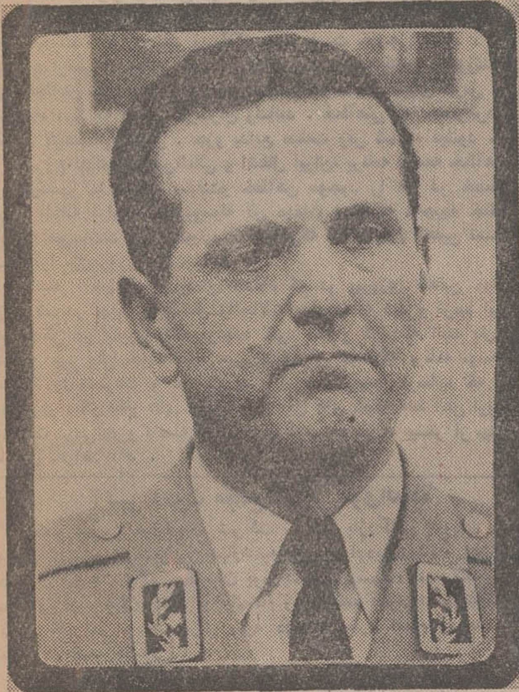
رئیس دادرسی ارتش هنگام مرگ ۵۲ ساله بود در صفحه ۴

امروز این نامه از طرف آقای مهندس وزیر دربار شاهنشاهی به آقای مهندس شریف امامی نوشته شد: جناب آقای مهندس شریف امامی نیابت تولیت عظامت بنیاد پهلوی خاطر مبارک اعلیحضرت همایون شاهنشاهی آریامهر از مرگ تیمسار سپهبد فرسیو رئیس اداره دادرسی ارتش بسیار متأثر است تیمسار سپهبد فرسیو در راه میهن و