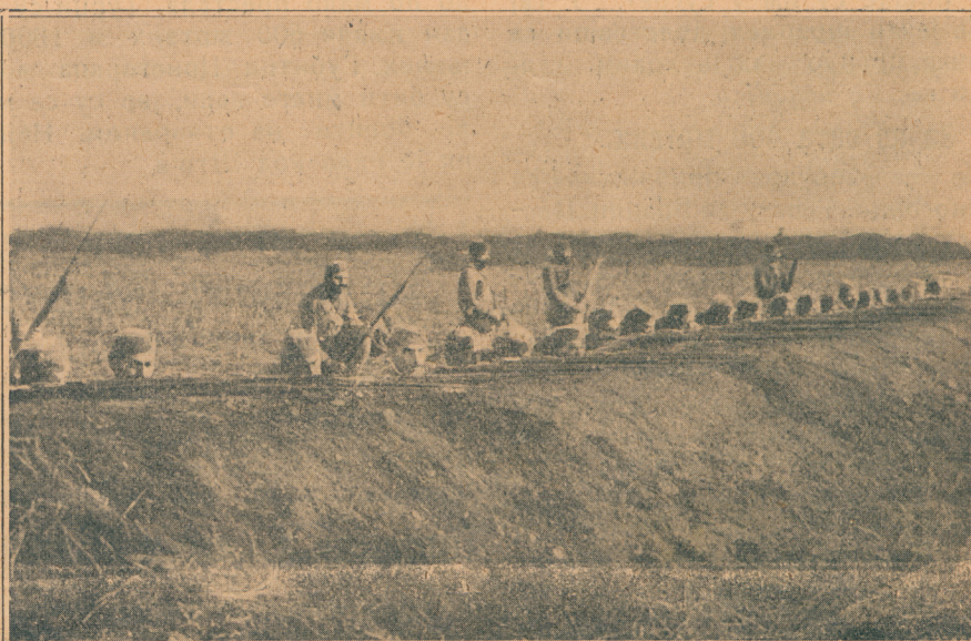
Црногорци ушанчени пред Скадром