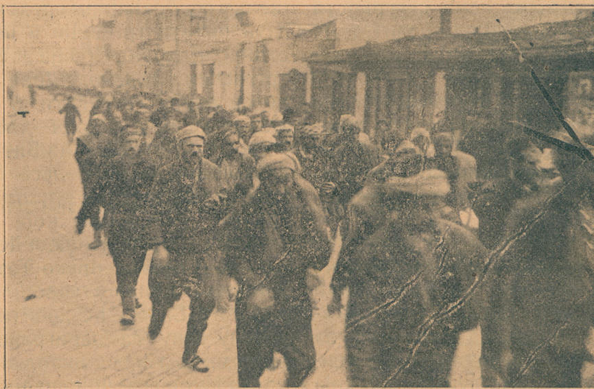
Заробљени Турци допраћени у Подгорицу

При бољој и савршенијој култури земљишта и исушивању мочарних крајева крај шемнице и Црне, ови би крајеви дали тако обилату жетву, да би се цела Србија могла да исхрани. Од свих крајева које је наша војска ослободила, ови су готово једини, који ће у материјалном погледу бити нека накнада за огромне материјалне губитке наше у овом рату и једини који ће помоћи брзом економском уздизању наше државе. Велика и многољудна варош као што је Битољ у овој плодној равни има и мора да има сјајну будућност. До сада, под турским режимом, Битољ поред свег природног богатства околине у којој лежи, није показао велике напретке. Зашто?