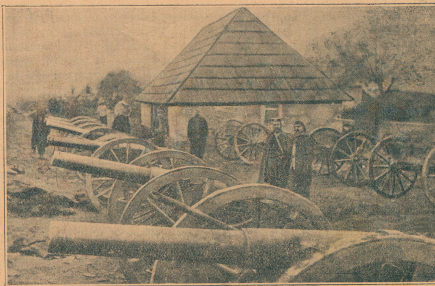
Од Црногораца заробљени турски топови на Јасиковцу

20. априла: Војници са Брдице хтели су да пређу к непријатељу. Некоји скадарски муслимани, који су се борили у шанчевима, отишли су к непријатељу питајући га, хоће ли пустити војницима да пређу. Срби су одговорили, да ће их дочекати са раширеним рукама; да се они боре против Турске, а не против појединих војника, који су достојни њиховог поштовања и дивљења. Осигуравши себи тако слободан пут, рекли су војници са Брдице својим официрима,