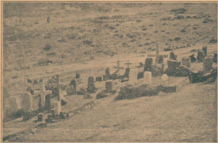
Са црногорског бојишта: Гробље палих јунака при јуришу на Бардањол

да ће оставити позиције ако им се не повећа оброк двопека. На Тарабошу је чинио један башалон боцио пушке и шанчеве и упутио се према граду. У сусрет им је дотрчао Есад-паша, који им је обећао, да ће оброк бити повећан са 100 грама. У јутро је међутим учињена та погрешка, да је оброк повећан само на Брдици и Тарабошу те су се ноћас побунили војници на Бардањолу. Трајало је све неколико сати и пали су многи метци; валија није држао за zgodно, да сам интервенира и заповедник позиција имао је да ствар реши сам. Али не буне се војници само због оброка; у истину они не осећају више снаге да издрже борбу, коју снашају већ шест месеци. Немају више вере у успех, знају, да ће сада бити безусловно побеђени. Узалуд је трпети муке опсаде, кад нема више наде у успех; боље је дакле предати се кад се нема од чега живети, те тако за времена узети непријатељу славу успеха. Тако мисле сви војници и говоре јавно.