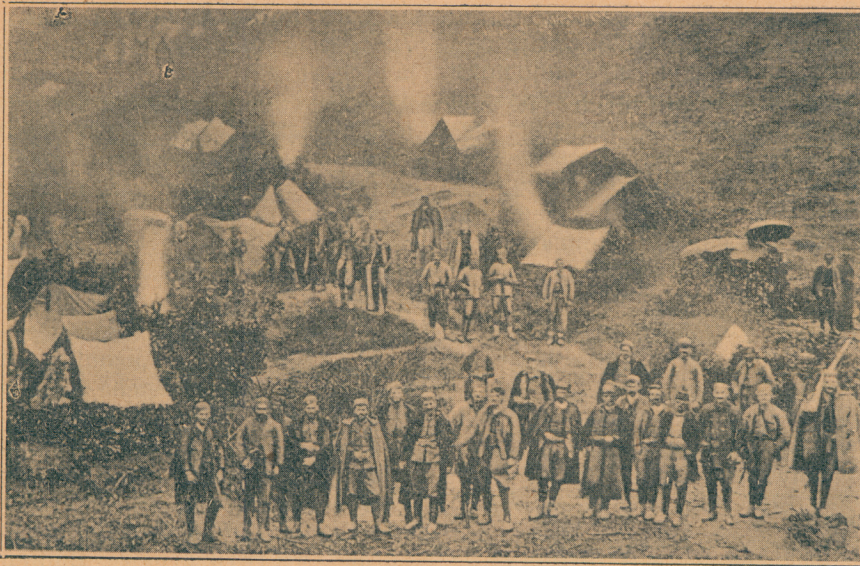
Црногорски логор под Бардањолом

макнувши се рече: — Стрелај ме али ме пусти да спавам.